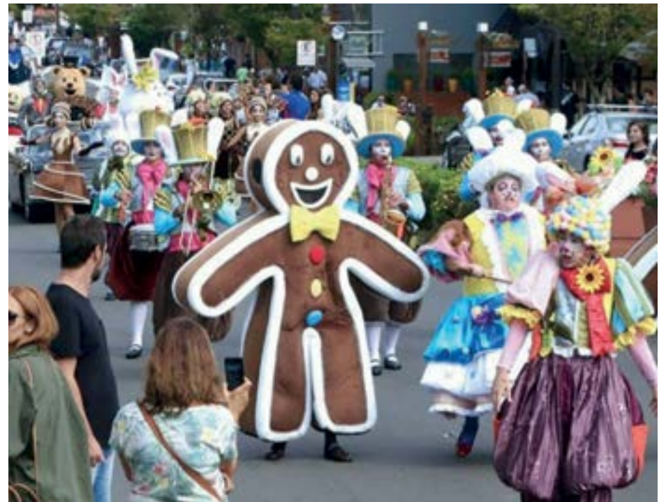
► A cidade de Gramado se transforma com as doces atrações que oferece aos seus visitantes