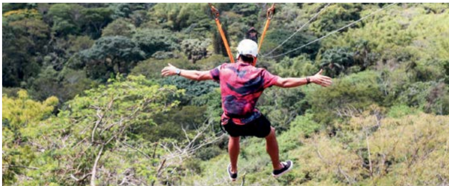
► Dentre os esportes radicais na região, a tirolesa é um dos mais procurados

Disque Camping: (21) 2532-0203 ou (21) 3549-4978