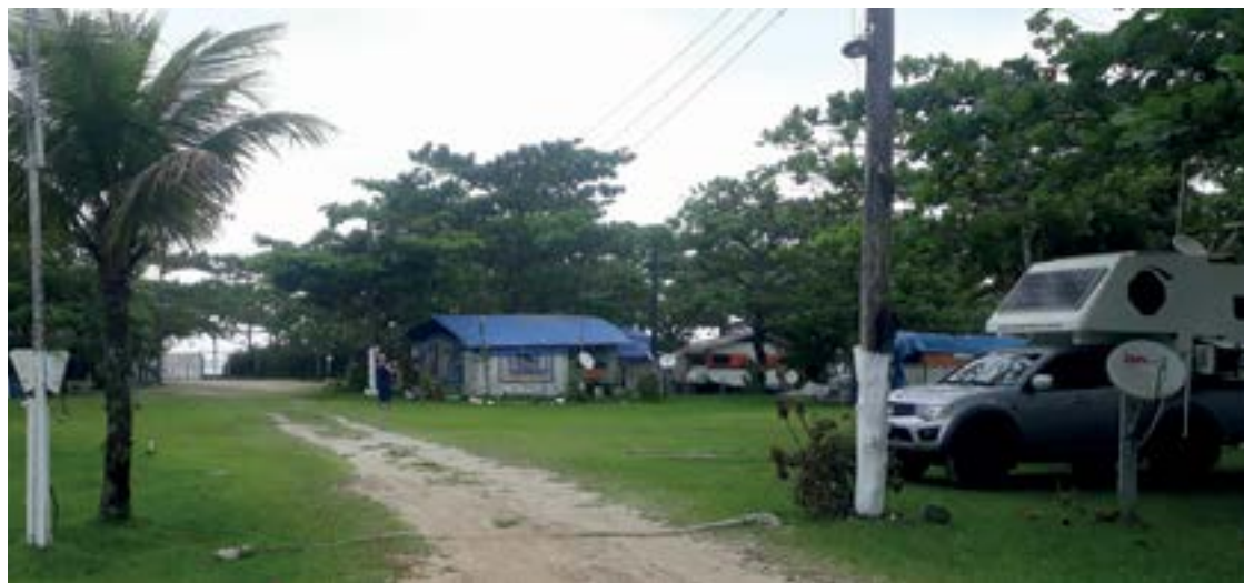
► O Camping de Bertioga, defronte à praia da Enseada, aconchegante e organizado

Atrativos - Bertioga oferece opções de descontração para toda a família, dentre elas, banhos de mar, tour por aldeia indígena, esportes náuticos e radicais, visita a construções históricas e passeios de escuna e de canoa. A praia da Enseada, próxima ao Camping, é indicada para banhos, prática de esportes náuticos e mergulhos no trecho Indaiá. Na divisa com São Sebastião, a cidade possui também uma aldeia que abriga 400 índios