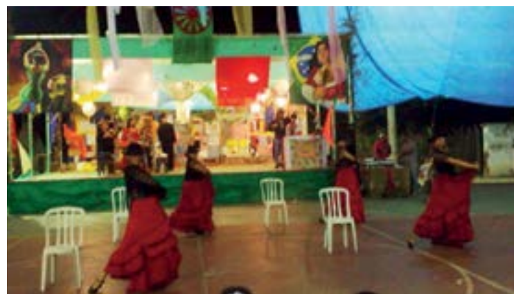
► Está de volta a magia da arte cigana, sempre envolvente

O ambiente da Festa contará com expositores, reunindo oraculistas, estandes com comidas típicas, peças de vestuário e acessórios, tudo emoldurado por uma decoração de fino gosto. Repetindo o esquema das festas anteriores, as atividades estarão se iniciando a partir das 15 horas de um domingo, com a aquisição dos convites individuais na portaria do camping, assim como a reserva de mesas com quatro cadeiras.