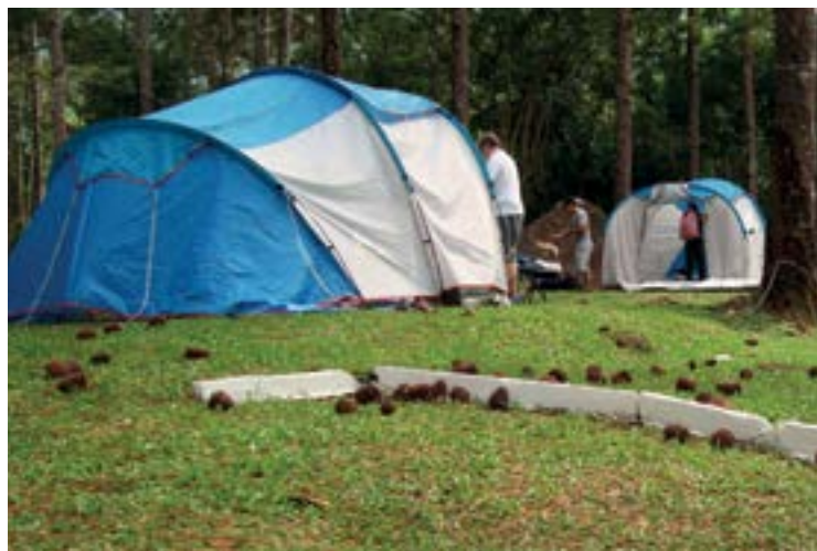
► Natureza pura espera Você para novos encontros com amigos