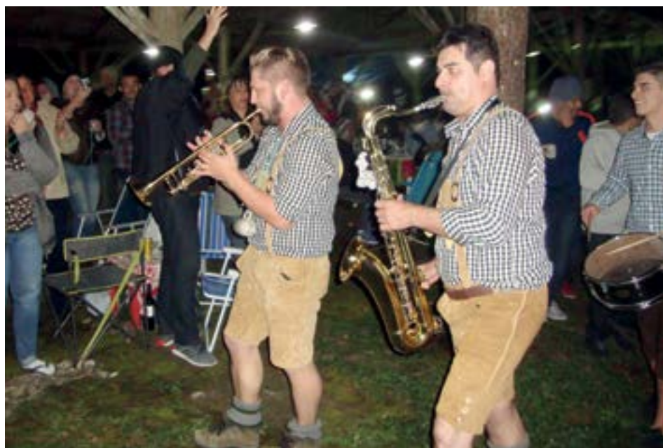
► Como sempre, os encontros do Grupo serão acolhedores e animados