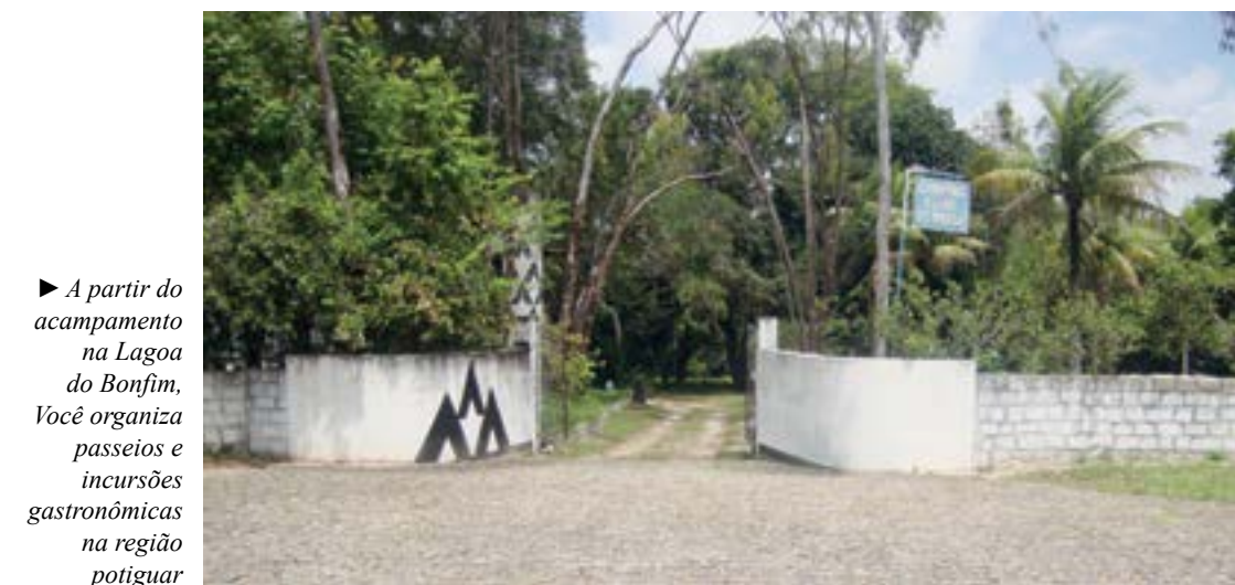
► A partir do acampamento na Lagoa do Bonfim, Você organiza passeios e incursões gastronômicas na região potiguar