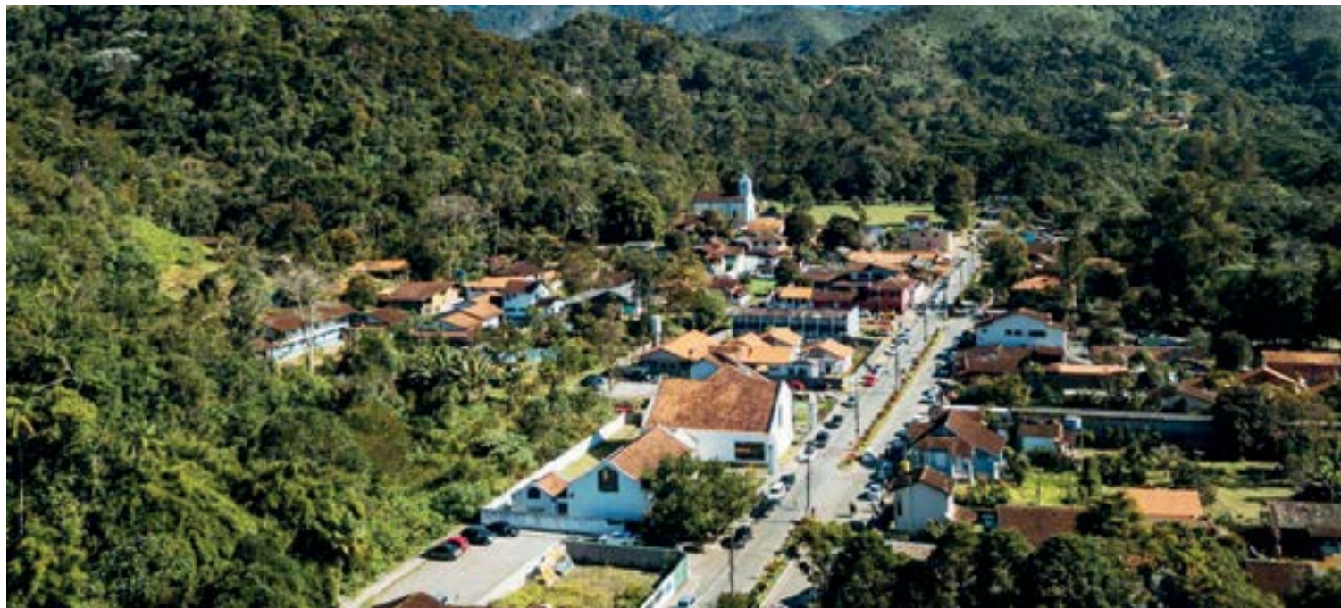
► A Vila de Visconde de Mauá reúne atrações naturais encantadoras, como a Cachoeira do Vêu da Noiva

Nunca é demais lembrar que temos pela frente alguns feriados, como o da Semana Santa, nos primeiros dias de abril, bem como o de Tiradentes, que esse ano também cai numa sexta-feira e, logo em seguida, o 1º de maio em uma segunda-feira. São excelentes oportunidades para “curtir” momentos no seu camping predileto, com direito a desfrutar de uns dias de sossego e descontração. Afinal, a proposta do CCB – idealizada por seu fundador Ricardo Menescal – é justamente reunir amigos e familiares em torno desta atividade de lazer junto à natureza. Muitas gerações tem frequentado as unidades do CCB ao longo de mais de cinco décadas – e outras virão –, todos irmanados por um mesmo propósito: vivenciar o autêntico estilo de amor na prática do campismo.