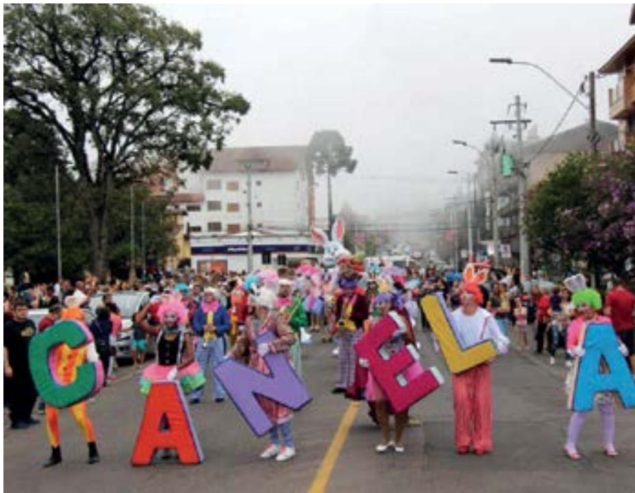
► A cada ano são mais envolventes as atrações da Páscoa em canela e Gramado