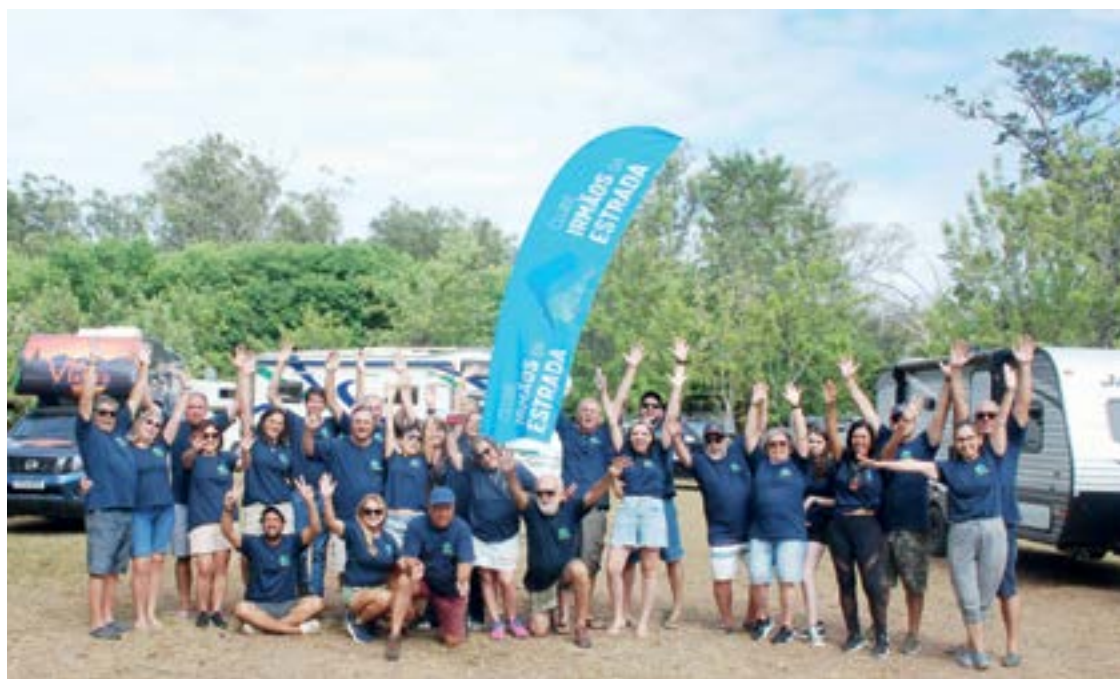
► O momento histórico da saída do Grupo rumo ao Parque Nacional de Santa Tereza