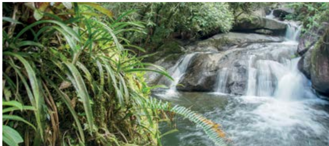
► As visitas aos poços e piscinas naturais completam as atrações naturais do camping