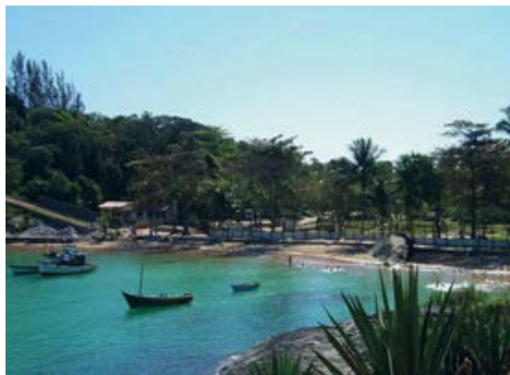
► Em maio, Guarapari vai sediar o Encontro do Grupo Toca-ES (Página 3)

Os encantos da Serra de Resende (Página 12)