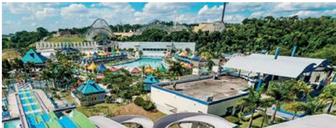
► Wet'n Wild, diversão para toda a família

Uma outra variação de divertimentos para as crianças é programar passeios por cidades que ofereçam opções de parques temáticos de diversões, com variedades de atrações capazes de ocupar dias inteiros de diversões.