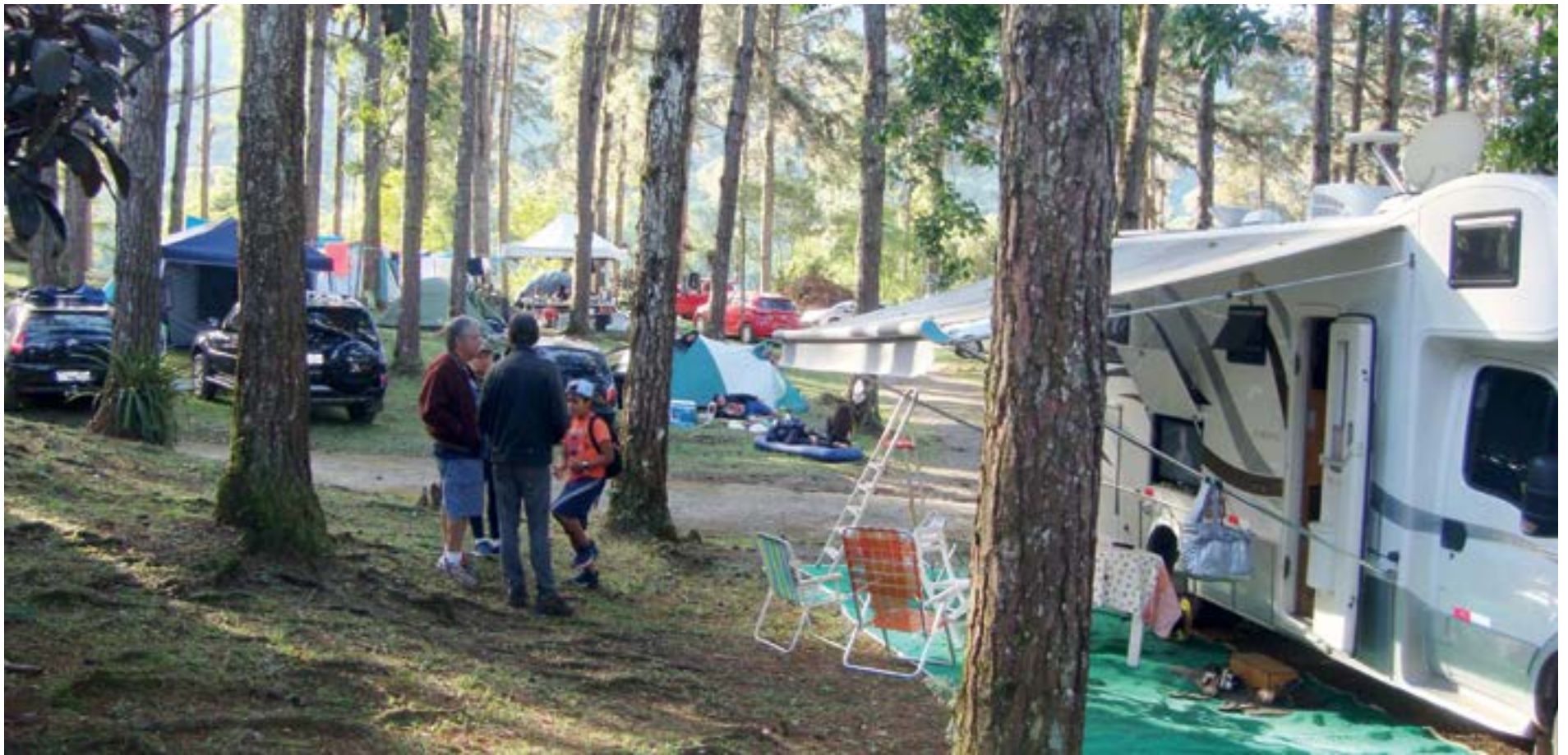
► O Camping da Serrinha está pronto para trazer de volta a Noite de Queijos e Vinhos no feriadão de Corpus Christi, em 10 de junho (Página 3)

RIO DE JANEIRO - MARÇO DE 2023 - Nº 601 - ANO L