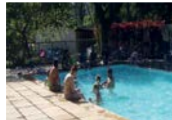
► Camping de Clube dos 500

CLUBE DOS 500 (SP-01) – km 60/SP da Via Dutra, Guaratinguetá (SP). Tel.: (12) 3122-4175. Instalações-padrão, luz para equipamentos (220v), chuveiros quentes, pavilhão de lazer, quadras de esportes, piscinas cloradas e playground. NÃO TEMPORADA: R$ 18,60 mais equipamento de R$ 2,00 até R$ 35,80; TEMPORADA (16/Dez. a 28/Fev.): R$ 19,40 mais equipamento de R$ 3,30 até R$ 37,40.