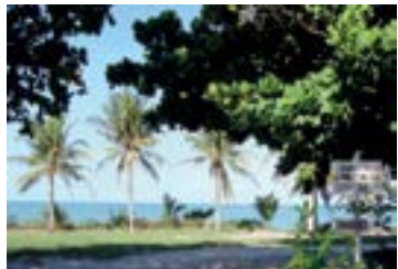
► Camping de Prado

PRADO (BA-03) – Praia do Farol. Instalações-padrão. Chuveiros quentes, quadra de esportes, praia fronteiria. Luz elétrica apenas para as dependências (220v), ponto de energia para carga de bateria de trailers. NÃO TEMPORADA: R$ 16,30 mais equipamento de R$ 2,00 até R$ 24,40; TEMPORADA (16/Dez. a 28/Fev.): R$ 22,60 mais equipamentos de R$ 3,30 até R$ 33,80.