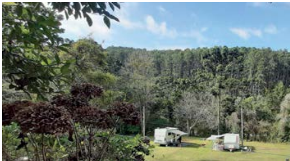
► Clima frio e atrações turísticas à disposição, acampando em Campos do Jordão

guaranis, numa área de quase mil hectares. No local há venda de artesanato e de plantas ornamentais. Para conhecer exposições de armas e de ocas indígenas, a dica é o Forte São João.