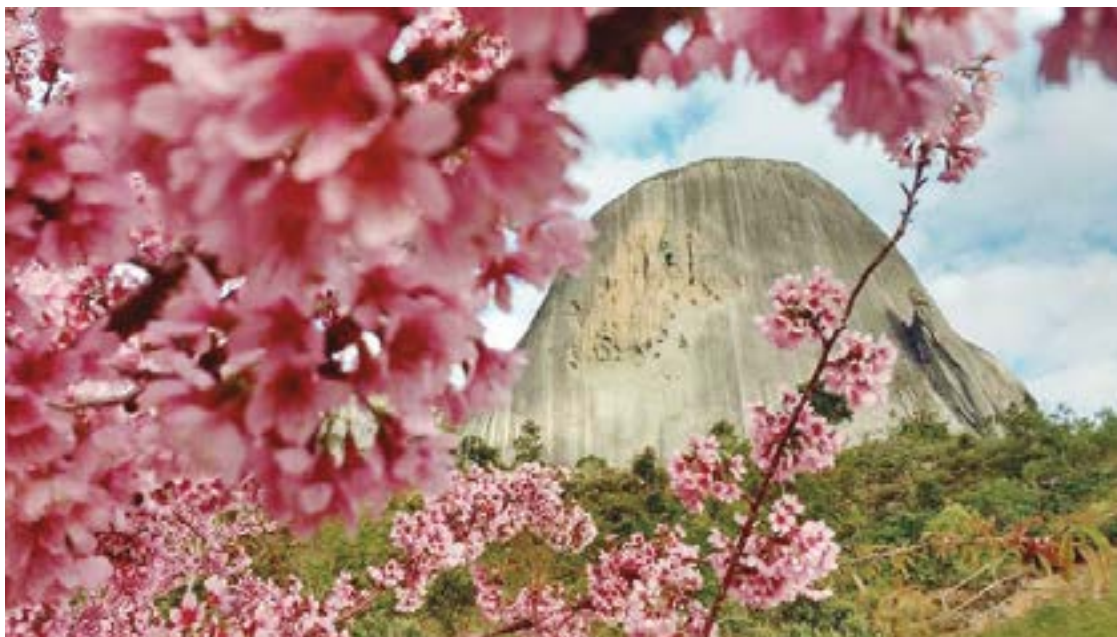
► Vale a pena caminhar e observar o nascer e pôr do sol no Bosque da Pedra Azul