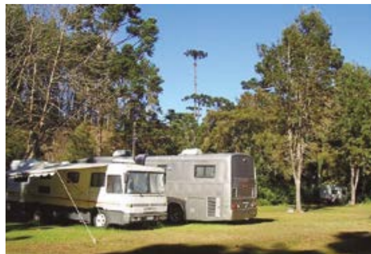
► Ecologia, passeios, gastronomia e Festival de Inverno acampando em Campos do Jordão (Páginas 6 e 7)

Neste mês, o Grupo Toca em Guarapari (Página 9)