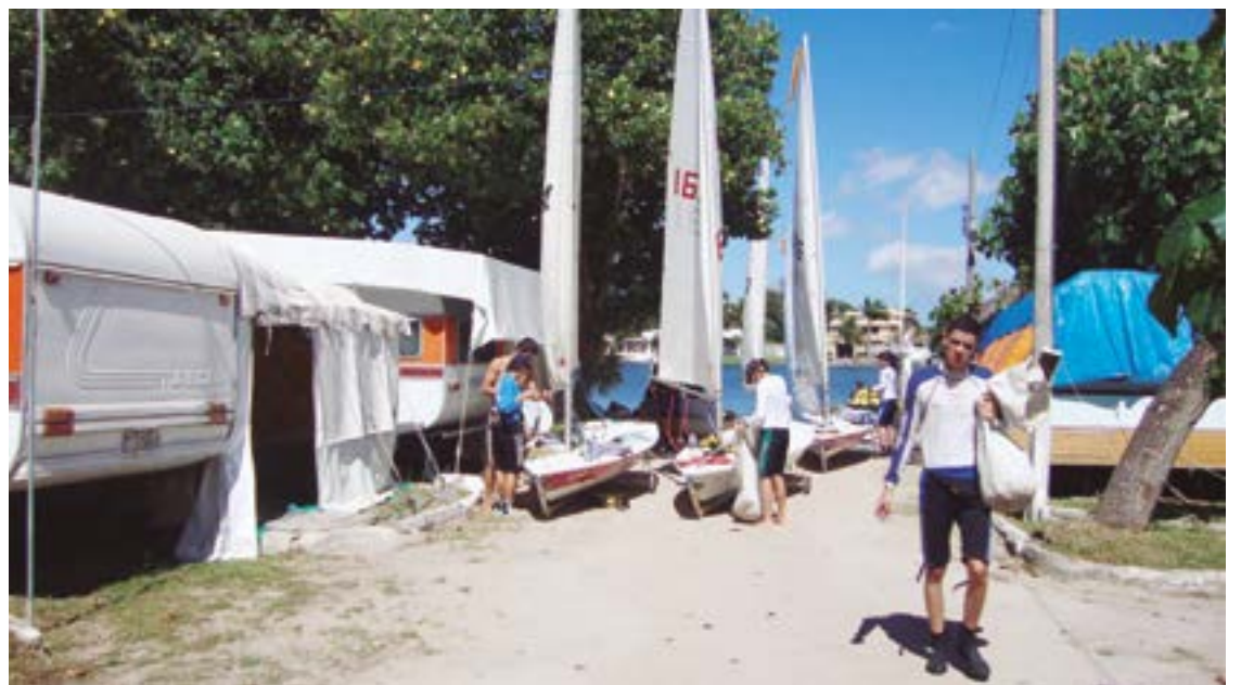
► O Camping de Cabo Frio, entre a via de acesso à cidade e o Canal de Itajuru