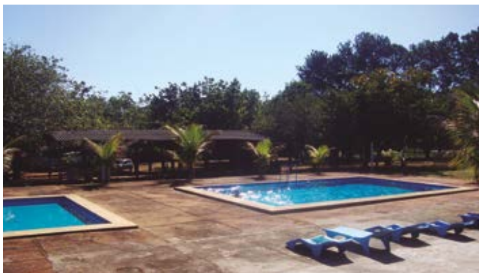
► Você pode desfrutar do maior centro termal do país acampando na área de Caldas Novas

praias de Martim de Sá e Grande da Deserta.