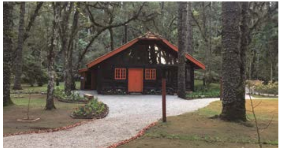
► Trilhas, tirolesa, arborismo e a paz da natureza Você encontra no Bosque do Silêncio