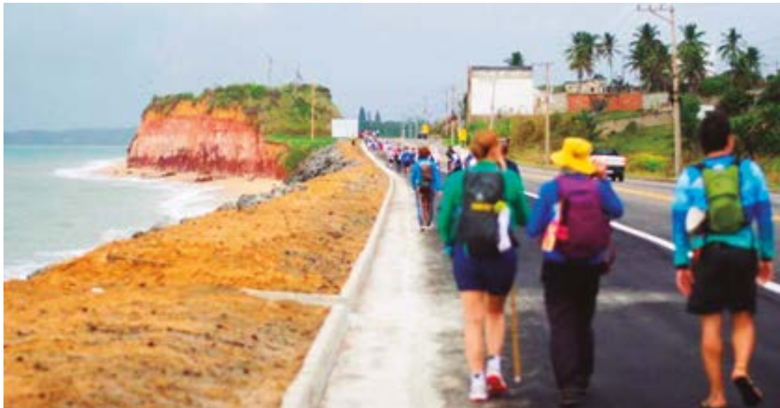
► Cresce a cada ano a quantidade de turistas interessados em participar das caminhadas do Passos de Anchieta

De toda essa extensão, o roteiro “Os Passos de Anchieta” resgata o trecho de 100 quilômetros compreendidos entre Anchieta e Vitória, que José de Anchieta percorria regularmente duas vezes por mês, o denominado “Caminho das 14 Léguas” que ele vencia à frente dos guerreiros temiminós que o acompanhavam na missão de cuidar do Colégio de São Tiago, erguido num platô da Vila da