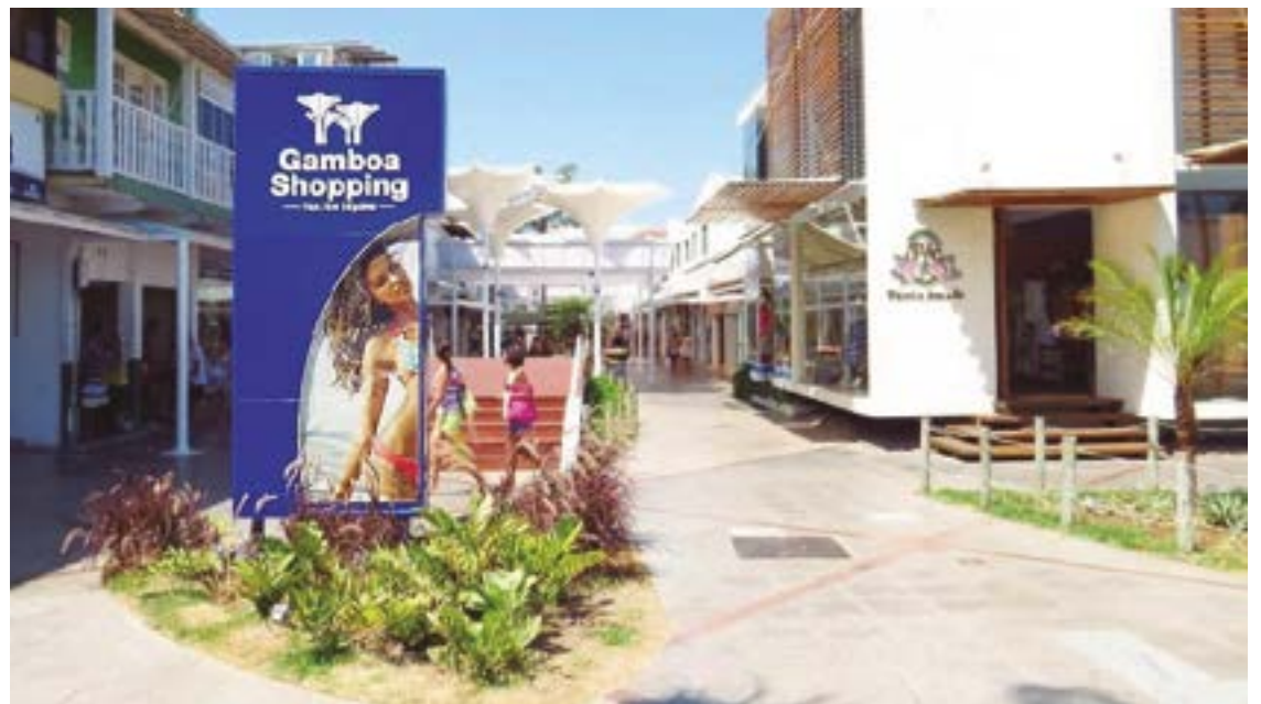
► A Rua dos Biquínis, ao lado do Clube Costa Azul, com mais de cem lojas de moda praia e esportes