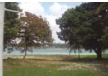
► Camping de Lagoa de Bonfim

LAGOA DO BONFIM (RN-02) – Av. Dr. Severino Lopes da Silva, 2500, Balneário Bonfim, Município de Nísia Floresta. Acesso pelo km 119 da BR-101. Instalações-padrão, luz para equipamentos (220v), chuveiros quentes, quadra de esportes, pavilhão de lazer, praia fronteira na lagoa. NÃO TEMPORADA: R$ 12,70 mais equipamento de R$ 2,00 até R$ 26,90; TEMPORADA (16/Dez. a 28/Fev.): R$ 16,30 mais equipamento de R$ 3,30 até R$ 42,50.