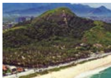
► Camping do Recreio dos Bandeirantes

PARATY (RJ-04) – Praia do Pontal. Tel.: (24) 3371-1050. Instalações – padrão, iluminação elétrica somente para as dependências, chuveiros quentes, praia fronteira. Camping de área reduzida. NÃO TEMPORADA: R$ 18,60 mais equipamento de R$ 2,00 até R$ 35,80; TEMPORADA (16/Dez. a 28/Fev.): R$ 25,20 mais equipamento de R$ 3,30 até R$ 45,80.