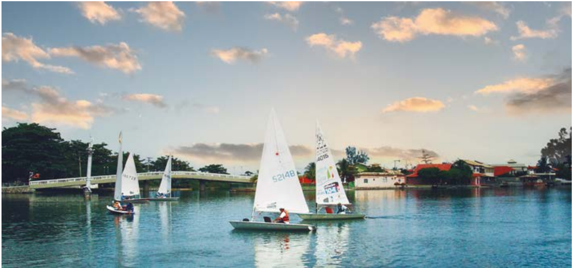
► Em Cabo Frio, passeios, momentos históricos, moda praia e o nosso camping, defronte ao Canal de Itajurú (Página 3)

RIO DE JANEIRO - MAIO DE 2023 - Nº 603 - ANO L