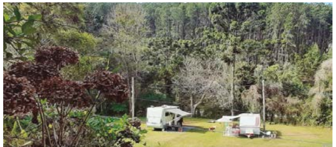
► Aproveite o inverno que está chegando e acampe em meio a uma natureza exuberante ao redor

Uma das atrações mais conhecidas e um locais dos mais bonitos de Campos do Jordão, o Museu de Esculturas Felícia Leirner, a céu aberto,