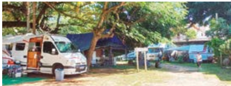
► O Camping de Guarapari está pronto para receber o Encontro