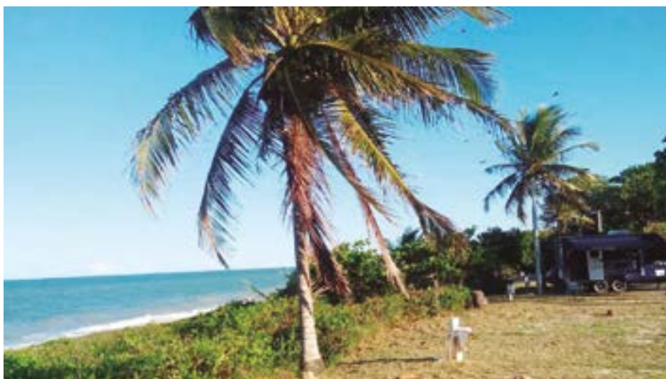
► A praia do farol, fronteira ao Camping de Prado é uma das mais fascinantes do Nordeste