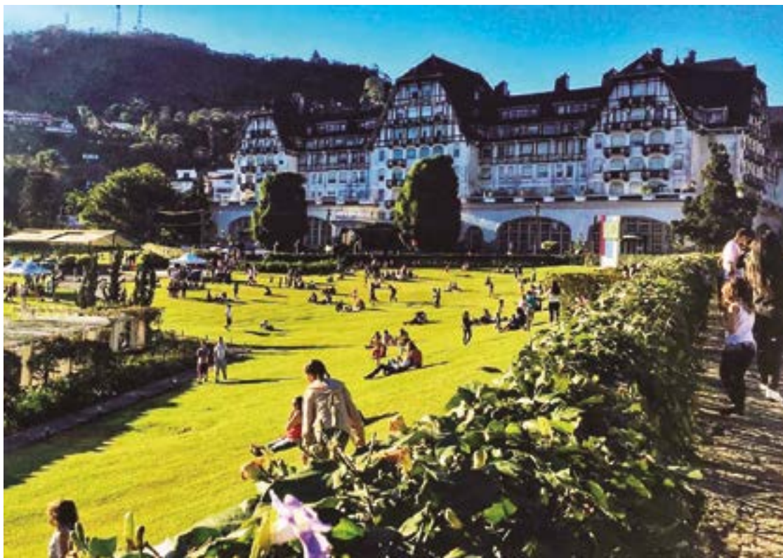
► O Festival de Petrópolis distribui suas atrações culturais pelos pontos turísticos da cidade

polis. Entre as atrações musicais confirmadas estão Luisa Sonza, Ferrugem, Poze, L7NOON e Vitinho. Os ingressos já estão disponíveis para venda no Guicheweb.