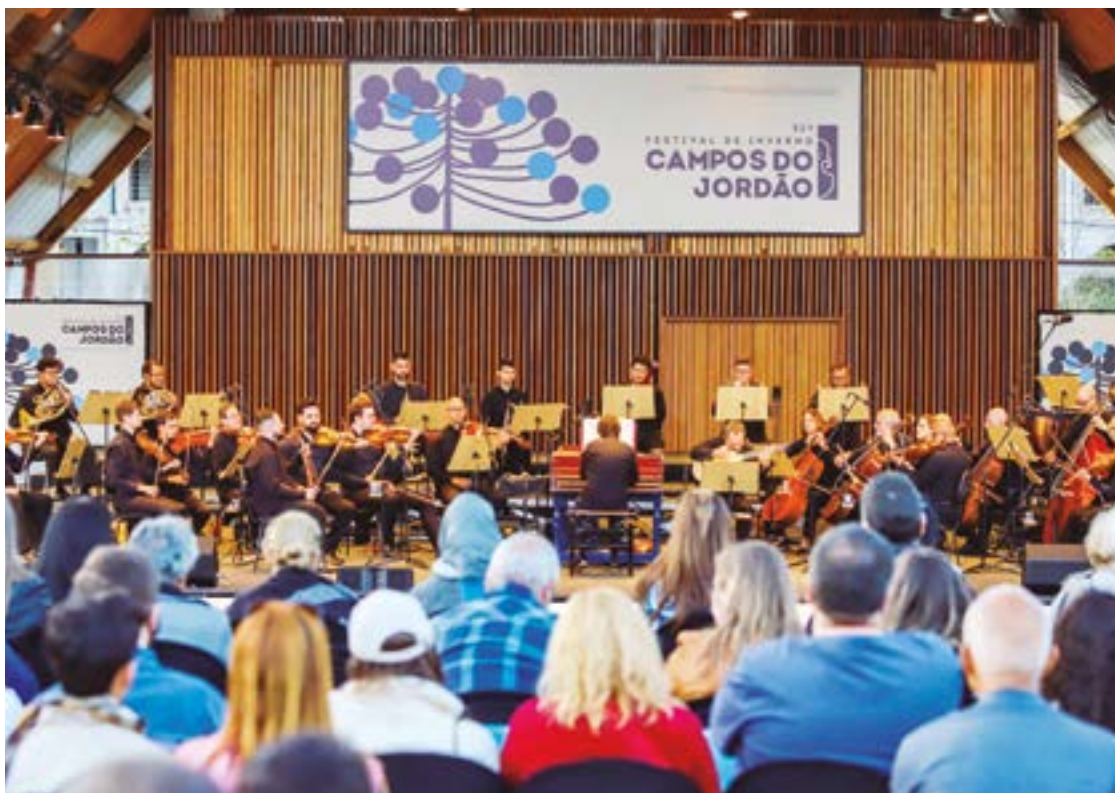
► Dos mais antigos do país, o festival de Inverno de Campos do Jordão dispensa elogios

No mês de junho próximo, acontece o Festival de Inverno de Nilópolis.