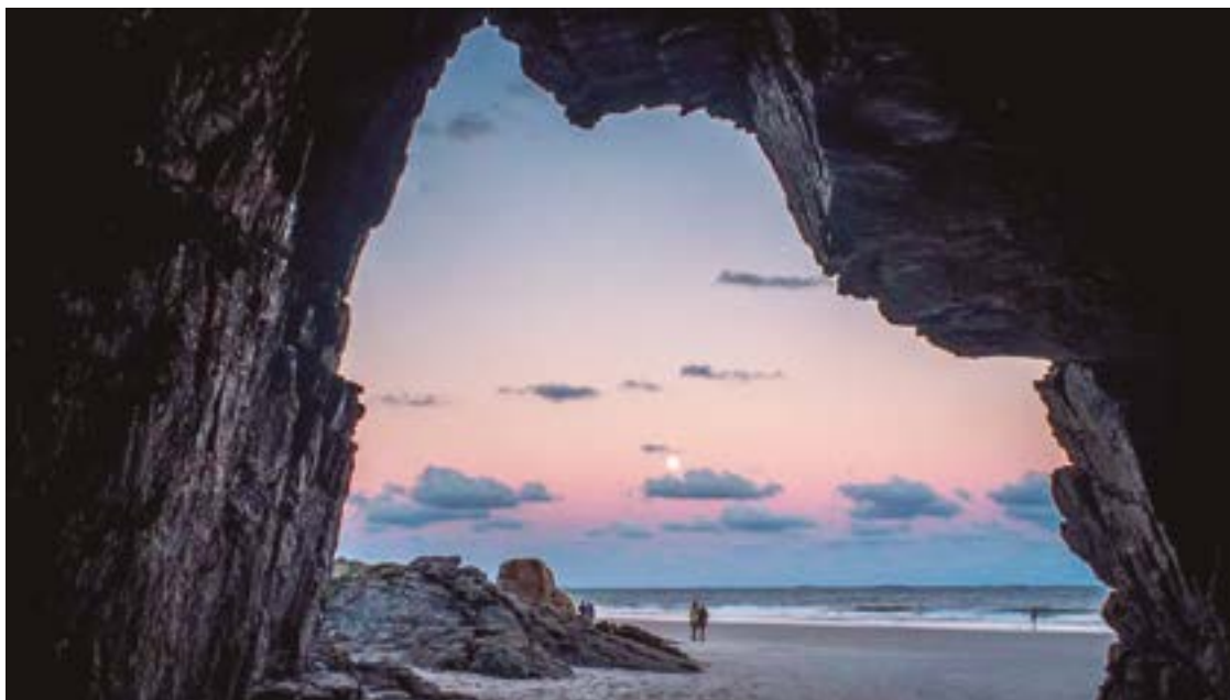
► A Gruta das Encantadas, na Ilha do mel, é a preferidas dos casais apaixonados

observe que a estrada não é asfaltada. Mas, assim mesmo, vale a pena.