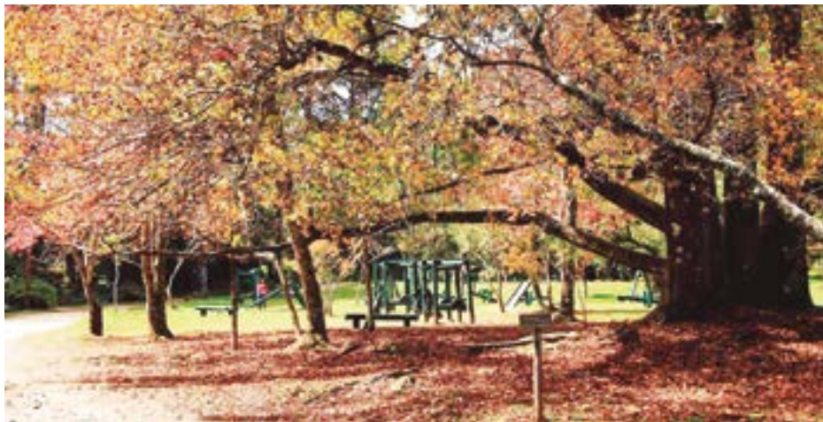
► A visita ao Horto Florestal, adiante do camping, proporciona passeios por trilhas, lagos e muita sombra e tranquilidade