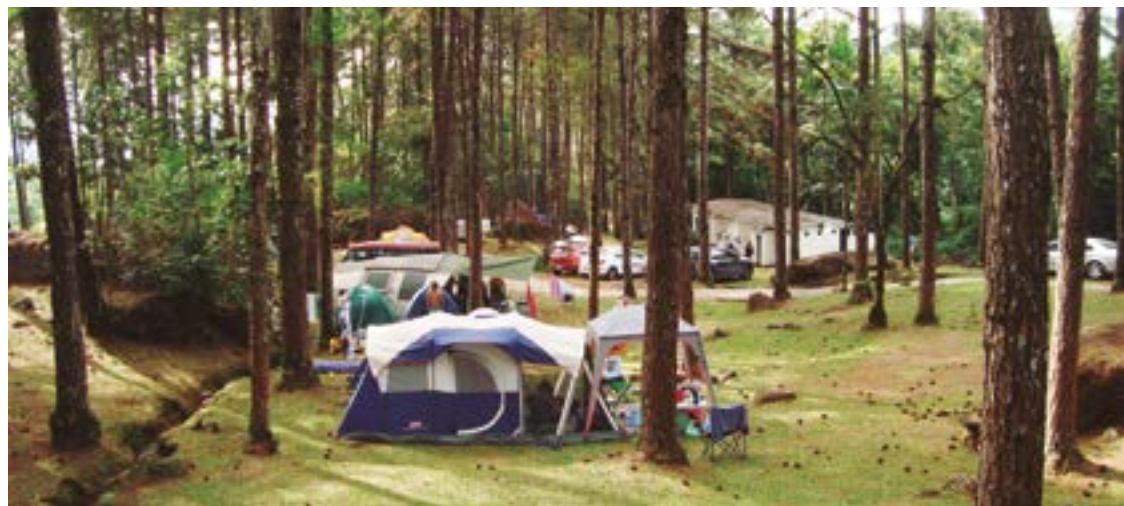
► O Camping da Serrinha está pronto para receber os campistas no feriadão de Corpus Christi

O Grupo está prestes a completar 29 anos de existência e suas atividades sociais estão à disposição no site www.tocaes.com e pelo e-mail tocacontato@gmail.com .