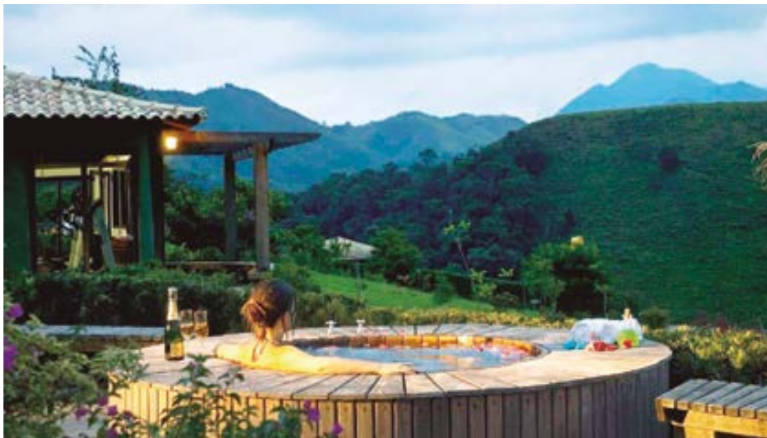
► Nada mais romântico do que o aconchego dos recantos e hospedagem de Visconde de Mauá

Uma das melhores opções de trilhas é o Vale do Alcantilado. Por lá, vai deslumbrar lindas paisagens e cachoeiras consideradas incríveis. Se for com o seu carro,