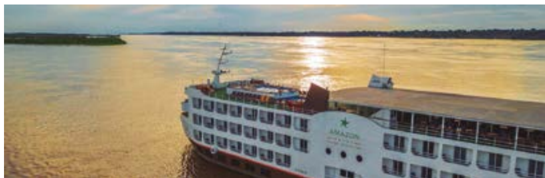
► Só mesmo vivendo um passeio de cruzeiro pelos rios da Amazônia é que se pode entender melhor a importância deste tesouro

Reafirmando o conceito de melhor conhecer para defender e preservar, cabe a sugestão de considerar em seus próximos programas de viagem um cruzeiro pela Amazônia a bordo do navio Iberostar Grand Amazon, em cabines exclusivas com varandas, alimentação "all inclusive", piscinas, salas fitness, restaurante Kuarup com gastronomia típica e convencional, em três noites, pelo Rio Solimões, ou em quatro, pelo Rio Negro, com variadíssimas programações no percurso.