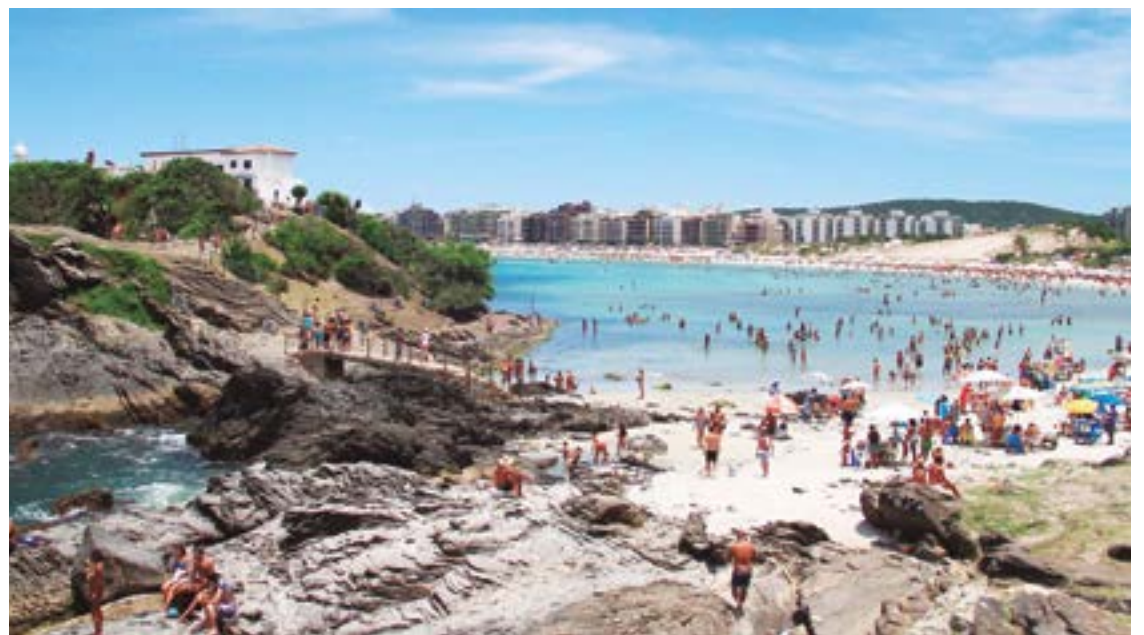
► A praia do Forte, mansa e tranquila é a preferida dos turistas