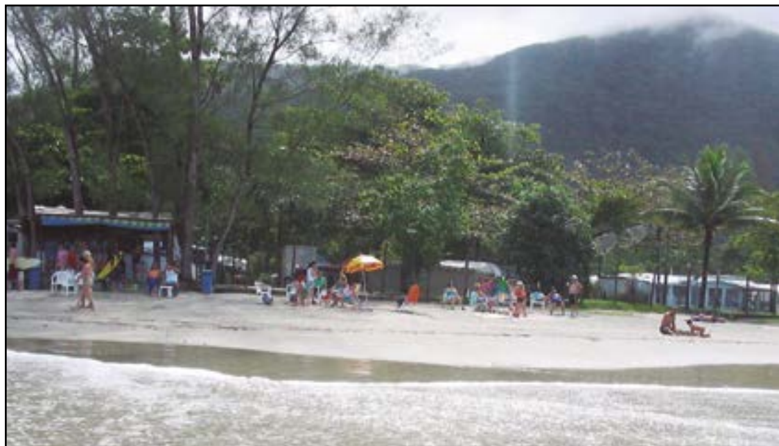
► Defronte à praia de Maranduba, o camping estará recebendo novamente para a tradicional festa