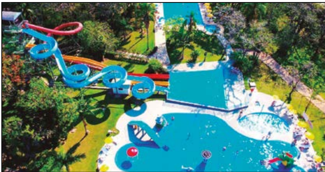
► Em Santa Catarina, a cidade de Gravatal reúne fontes termais famosas no mundo inteiro