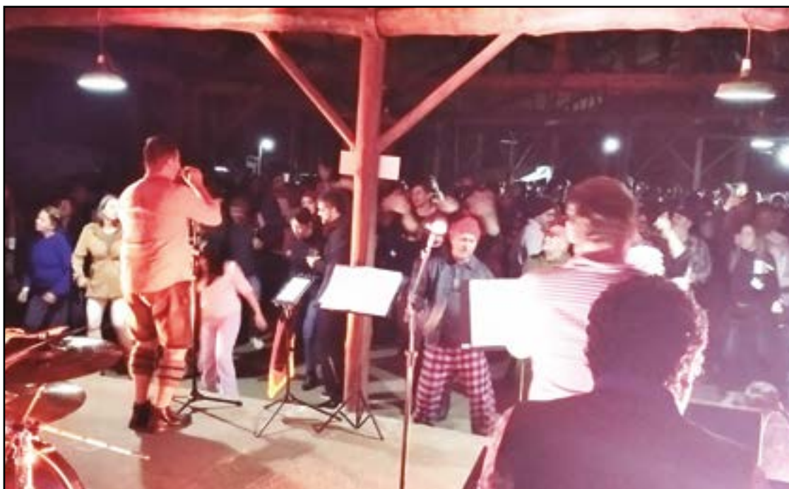
► À noite, integração total entre os campistas e a Banda Tureck