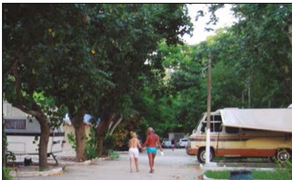
► Somente pelas praias as regiões, vale a pena acampar em Cabo Frio

pos do Jordão, Piquete e Delfim Moreira. Ao sul, bem próximas, ficam Lagoinha, Cunha e Aparecida.