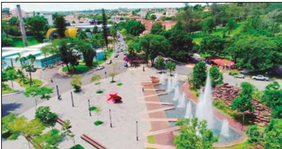
► As fontes termais em Águas de São Pedro (SP) são ricas em componentes benéficos à saúde

enquanto se curte as temperaturas terapêuticas das águas termais.