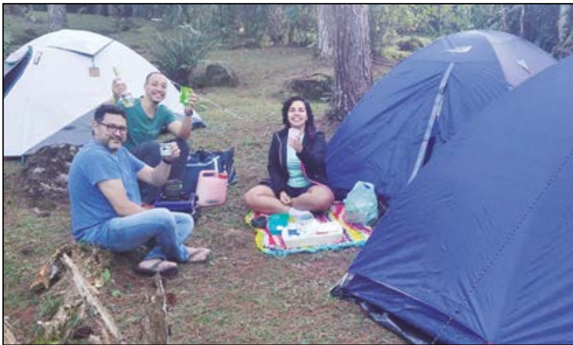
► Antes da festa, em cada canto, um papo amigo e um brinde à natureza