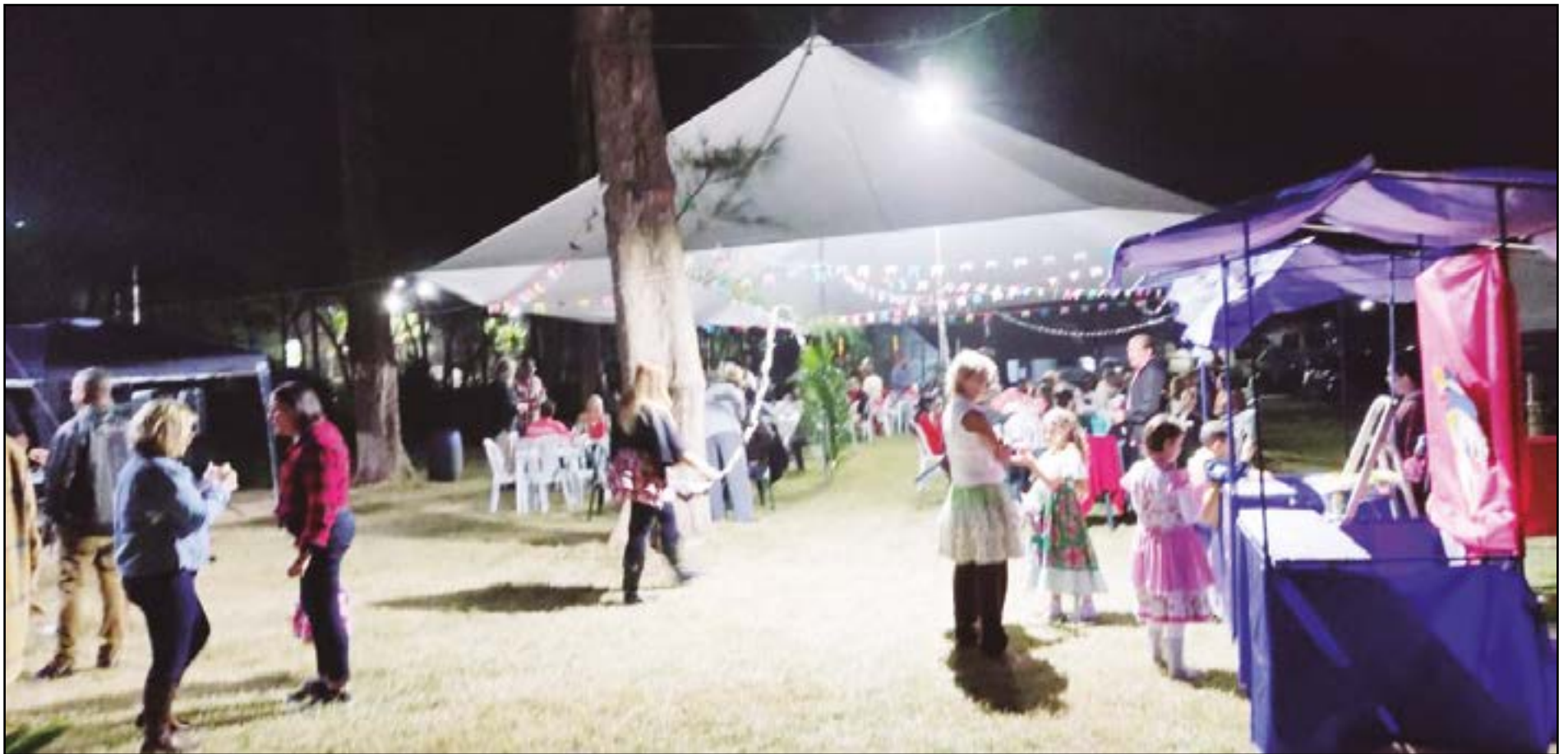
► O camping do Recreio dos Bandeirantes volta com a sua tradicional festa Julina, no último sábado deste mês, dia 29

RIO DE JANEIRO - JULHO DE 2023 - Nº 605 - ANO L