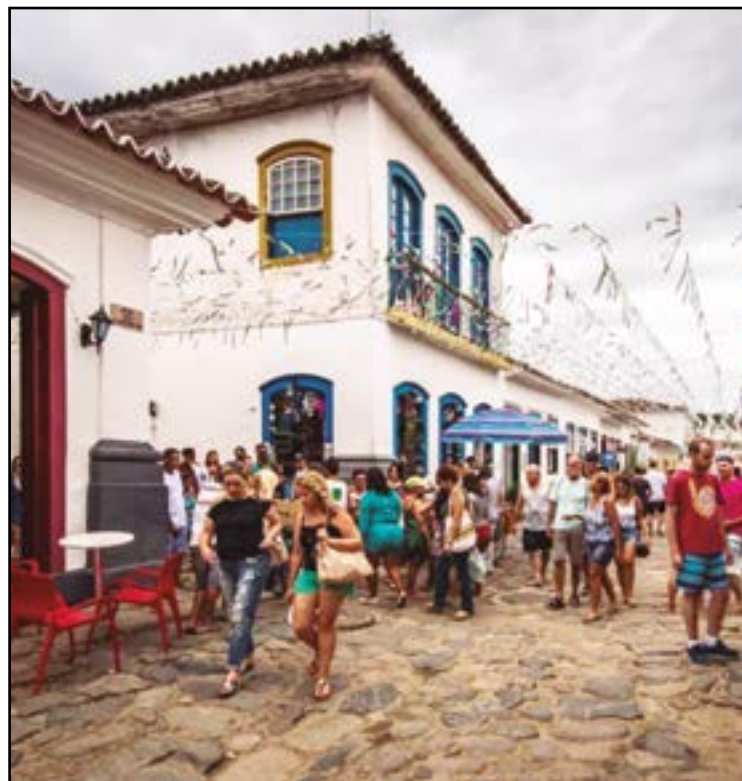
► Durante o Festival, Você degusta as melhores marcas da região

O Festival da Cachaça, Cultura e Sabores de Paraty 2023 será realizado no período de 17 a 20 de agosto próximo, na Av. Nossa Sra. dos Remédios, 172-240 – Pontal, no centro histórico da cidade. O primeiro Festival foi realizado em 1982, sob o nome oficial de Festival da Pinga e Produtos Típicos de Paraty. Com o objetivo divulgar a região, a cultura local e a cachaça, bebida tipicamente brasileira.