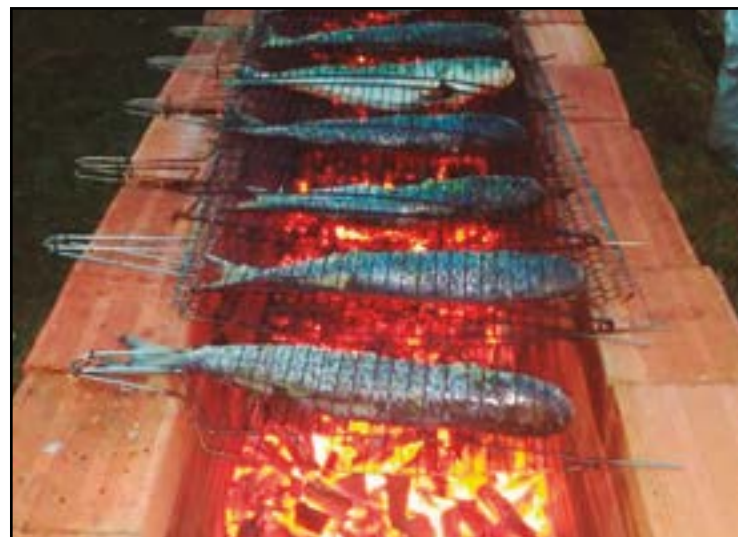
► Em 9 de setembro próximo, em Ubatuba, a Festa da Tainha (Página 9)