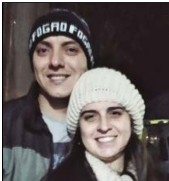
► Entre os casais, com brilho nos olhos, o amor estava no ar