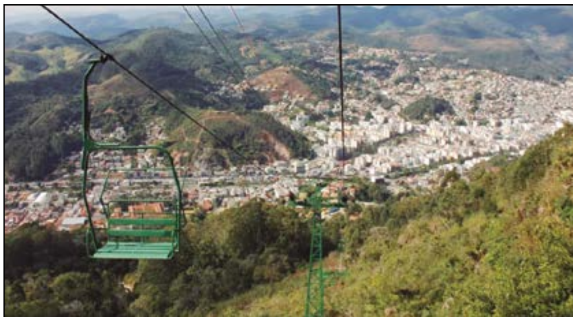
► A bordo do teleférico, uma visão ampla dos encantos da cidade

Presença rica de vegetação, nascentes de águas cristalinas, bem como de belos pinheiros e de outras árvores características da região. Até a famosa Araucária, do Paraná, em risco de extinção, o campista encontrará nesta região do Sudeste. É o ponto de partida para opções de lazer que proporcionam contato direto com a natureza pelas caminhadas ecológicas, a prática de canoagem, os banhos