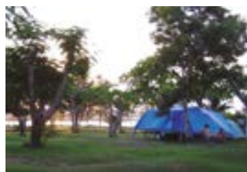
► Camping de Cabo Frio

(16/Dez. a 28/Fev.) R$ 26,50 mais equipamento de R$ 3,50 até R$ 48,20.