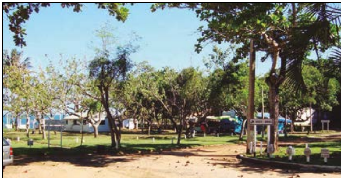
► A partir do acampamento em Guarapari, Você pode conhecer praias encantadoras

Acesso - O camping fica a aproximadamente 185 km da capital paulista e 261 km do Rio de Janeiro. Para chegar à unidade, seguir pela Rodovia Presidente Dutra até o km 60, em Guaratinguetá, onde está a unidade. Ao norte do camping estão localizadas as cidades de Cam-