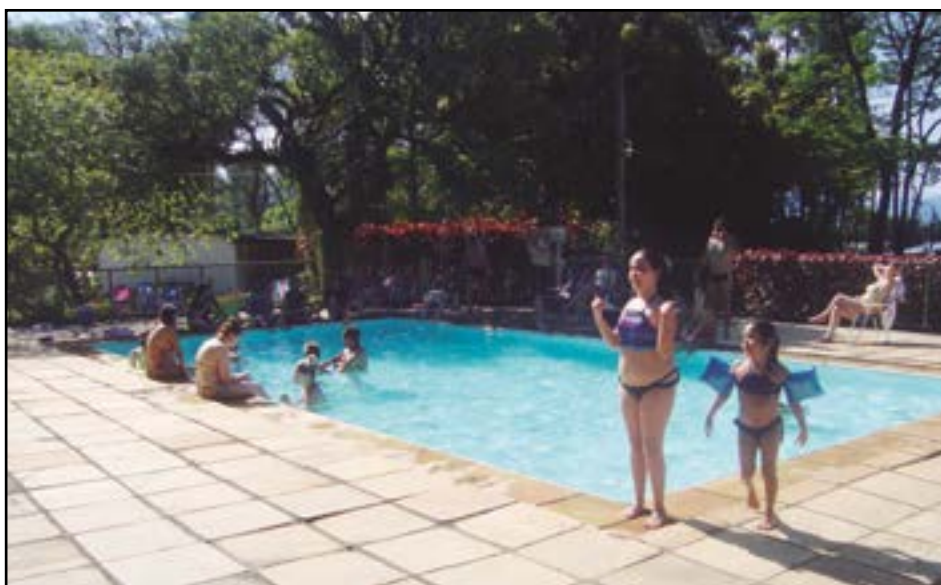
► No Clube dos 500, o campista conta com lazer variado