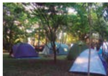
► Camping do Clube dos 500

CLUBE DOS 500 (SP-01) – km 60/SP da Via Dutra, Guaratinguetá (SP). Tel.: (12) 3122-4175. Instalações-padrão, luz para equipamentos (220v), chuveiros quentes, pavilhão de lazer, quadras de esportes, piscinas cloradas e play-ground. NÃO TEMPORADA: R$ 19,60 mais equipamento de R$ 2,10 até R$ 37,70; TEMPORADA (16/Dez. a 28/Fev.): R$ 20,40 mais equipamento de R$ 3,50 até R$ 39,40.