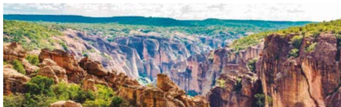
► Na Serra da Capivara, Você pode sequenciar seus passeios entre circuitos e trilhas organizadas no parque

O Parque Nacional Cavernas do Peruaçu é um complexo subterrâneo, com formação de calcá-