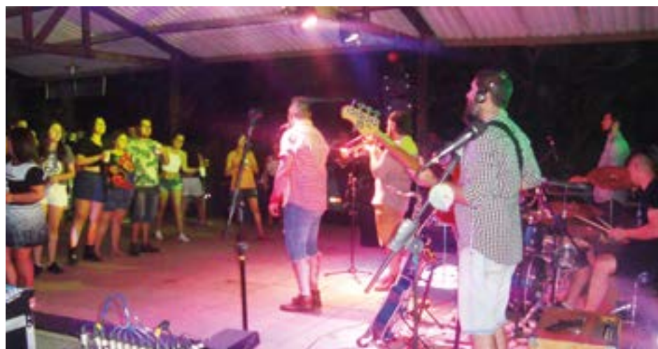
► A Banda Tureck sempre presente com a sua alegria envolvente