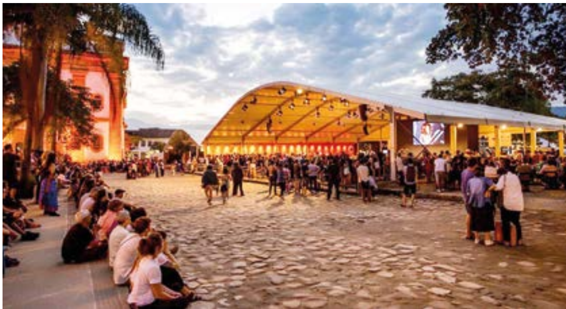
► A Festa Literária deste ano promete novos temas e homenagens

Desde 2003 a Flip oferece todos os anos em Paraty uma experiência permeada pela literatura. Em conexão com a cidade que a recebe, a festa é mais do que um evento: Trata-se de uma importante manifestação cultural com interlocução permanente entre as artes que propagam vivências focadas na diversidade.