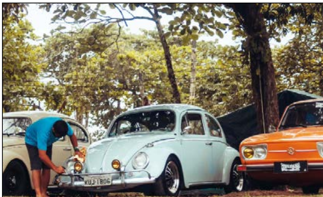
► Dois atraentes festivais de saudosismo, um no Recreio dos Bandeirantes...

Low Bugs é o primeiro grupo de Air Cooled criado na cidade do Rio de Janeiro e tem como foco reunir pessoas apaixonadas, este é o termo, por automóveis antigos, especialmente pelos modelos Volkswagen com mecânica refrigerada a ar, como o Fusca, a Kombi, Brasília e Variant, em qualquer estilo ou fase de restauração, uma forma de preservar a história automobilística nacional, que durante décadas teve como referências marcantes alguns desses modelos.