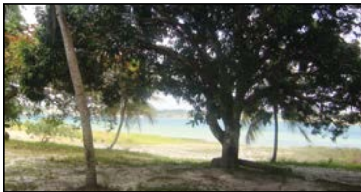
► Lagoa do Bonfim, uma escala possível para as praias potiguares

reção a Rio Bonito. Depois de contornar à direita o perímetro urbano de Itaboraí, seguir à esquerda por Cachoeira de Macacu, subindo a serra em direção a Nova Friburgo. O acesso ao camping é feito no km 69 da rodovia Rio-Friburgo, dobrando à esquerda, cerca de 2 km após o início da descida da serra em direção a cidade, defronte ao totem de limitação de velocidade.