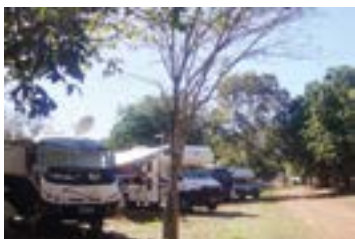
► Camping de Caldas Novas

GUARAPARI (ES-01) – Praia de Setiba. Tel.: (27) 3262-1325. Instalações-padrão, luz para equipamentos (220v), chuveiros quentes, quadra de esportes, cantina, praia fronteira. NÃO TEMPORADA: R$ 21,00 mais equipamento de R$ 3,00 até R$ 40,20; TEMPORADA (16/Dez. a 28/Fev.): R$ 27,50 mais equipamento, de R$ 4,00 até R$ 50,00.