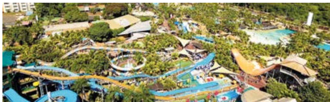
► Thermas dos Laranjais oferece atrações para todos os públicos

Afora um programa voltado apenas para a diversão em família, como a visita a um parque de diversões, Você pode fazer um passeio de conscientização, em um cruzeiro pela Amazônia, a bordo do navio Iberostar Grand Amazon, em cabines exclusivas, com varandas externas, alimentação "all inclusive", piscina, sala fitness, gastronomia tropical local e internacional, drinques e aperitivos. Os roteiros podem ser de três noites no Rio Solimões, ou de quatro noites pelo Rio Negro, ou de sete noites pelos dois rios. Por incrível que possa parecer, consulte antes a Operadora sobre a existência de calado nesses afluentes que sejam suficientes para o trânsito dos navios. Você pode ainda fazer caminhadas por trilhas, visita à Casa do Caboclo, pesca de piranhas, focagem de jacarés.