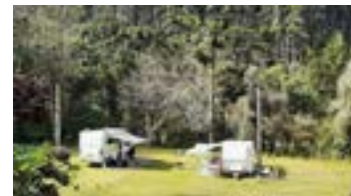
► Camping de Campos do Jordão

CAMPOS DO JORDÃO (SP-02) – Estrada do Horto Florestal, bairro Rancho Alegre. Instalações-padrão, luz para equipamentos (220v), chuveiros quentes, sauna, pavilhão de lazer, cantina, lareira e play-ground. NÃO TEMPORADA: R$ 21,00 mais equipamento de R$ 3,00 até R$ 40,20; TEMPORADA (16/Dez. a 28/Fev.): R$ 27,50 mais equipamento de R$ 4,00 até R$ 50,00.