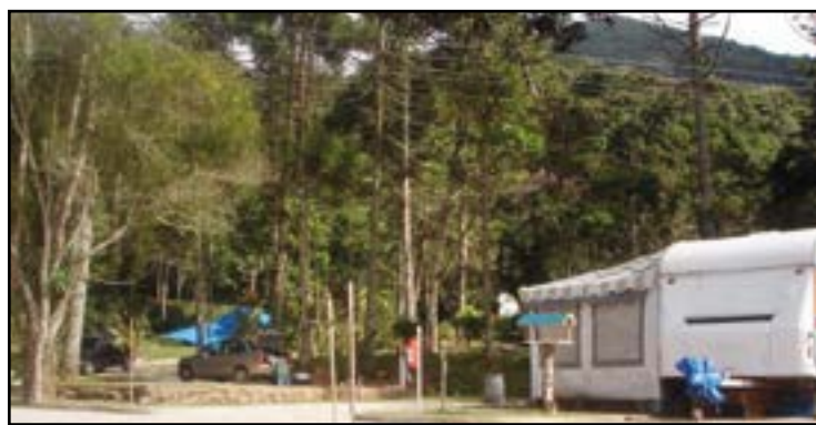
► No entorno do Camping de Mury, uma variedade gastronômica

Acesso - Os campistas que saem do Rio de Janeiro percorrem uma distância de 150 km no acesso feito pela BR-101 em di-