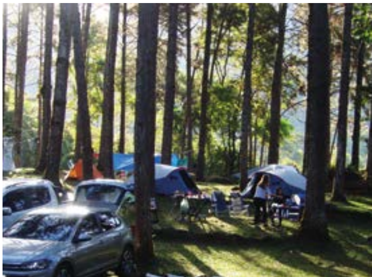
► Um dia de sol propício à contemplação da natureza