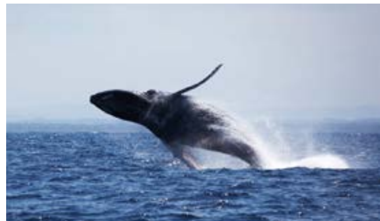
► São espetaculares os bailados das baleias nos mares do sul da Bahia

As empresas que trabalham com o turismo de observação já se preparam para receber os visi-