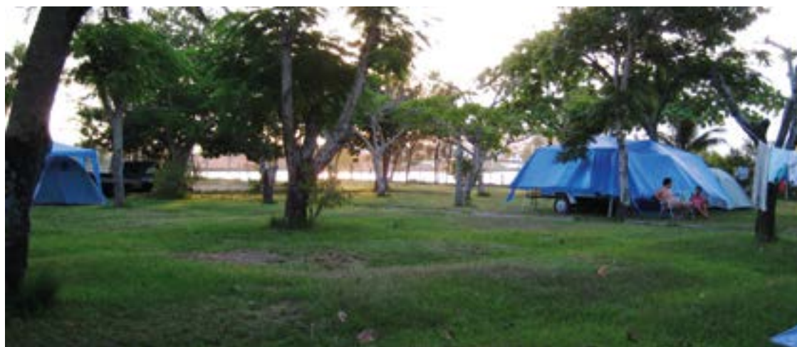
► O Camping de Cabo Frio possibilita acessos de barcos para o mar ou para a Lagoa

e baladas noturnas Cabo Frio. A cidade praiana abriga o Convento Nossa Senhora dos Anjos, construído no final do século XVII, que atualmente é a sede do Museu de Arte Religiosa e Tradicional. Se Você procura uma viagem regada de cultura e história, o lugar não pode ficar de fora da sua lista de pontos turísticos a visitar. Com arquitetura colonial, este antigo convento franciscano é tombado pelo Patrimônio Histórico Nacional e compõe um inesquecível passeio cultural pela cidade de Cabo Frio. Um dos destaques do local é o conjunto de pinturas no interior da capela-mor. Endereço: Largo de Santo Antônio - Centro / Telefone: (22) 98154-0088 / Horário de funcionamento: De terça a sexta-feira das 10h às 17h. Sábados e feriados das 10h às 14h.