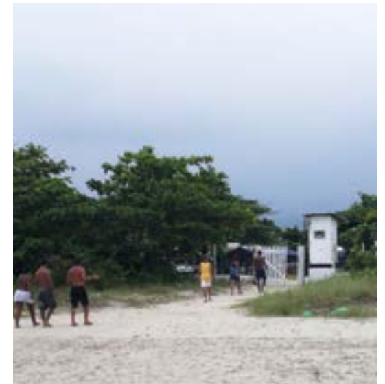
► Defronte à Praia da Enseada, o Camping de Bertioga