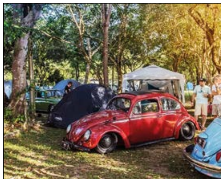
► ... e outro em Guarapari, ambos imperdíveis