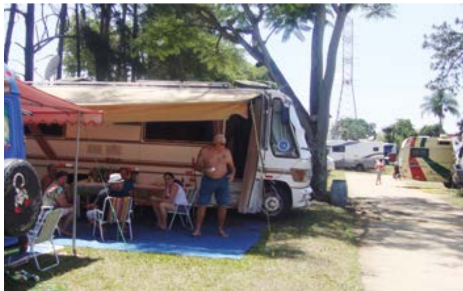
► Desde cedo, os campistas se confraternizam no camping

Camping do Clube dos 500: (12) 3122-4175 Disque-Camping: (21) 3549-4978 / 2524-5794