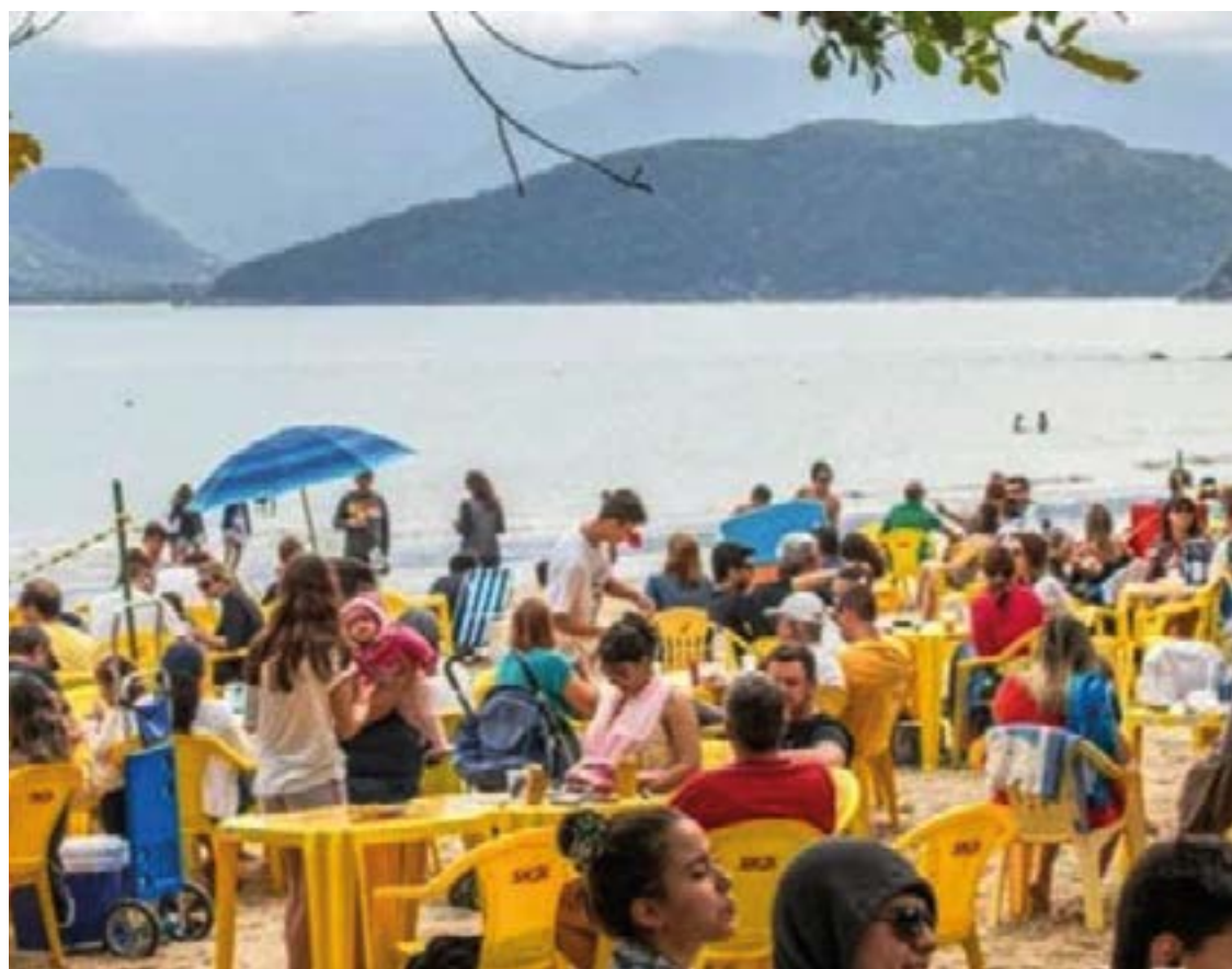
► Uma tradição gastronômica que se renova a cada ano

Evento: 28º Festival do Camarão da Almada Data: 25 a 28 de julho de 2024 Local: Praia da Almada / Ubatuba Instagram: @praiaalmada Site: www.ubatuba.sp.gov.br Camping de Ubatuba (SP-04): (12) 3843-1536 Site do CCB: www.campingclub.com.br Whatsapp do CCB: (21) 98286-7627 Disque Camping: (21) 3549-4978 / (21) 2524-5794