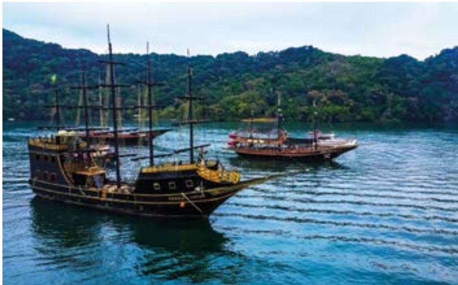
► Os passeios de barcos pelos rios da região são agradáveis e contemplativos

O canal de Bertioga, local de encontro das águas dos rios com a do oceano, é uma marina natural à espera do turista que busca atividades náuticas. Escunas estão atracadas próximo ao forte São João à disposição de turistas que desejam apenas um agradável passeio ao longo da região costeira do município. Escunas, Traineiras e Lanchas podem ainda ser alugadas para passeios e pescarias em alto mar. Os locais mais procurados são o