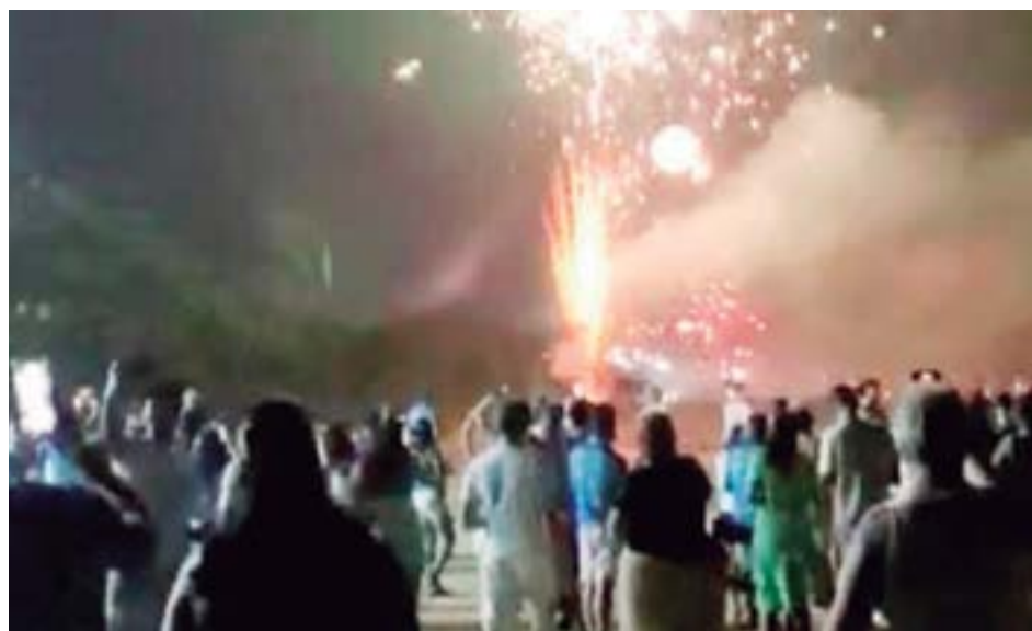
► A animação de sempre no Camping de Bertioga, com o tradicional festejo dos fogos

Em outros campings não menos animados, como Campos do Jordão, Clube dos 500, Mury, Paraty, Cabo Frio, Serrinha, Guarapari as manifestações das famílias em confraternização aconteceram em grupos reunidos no aconchego das cantinas ou nos limites dos seus equipamentos, todos igualmente eufóricos e esperançosos de dias melhores neste novo ano.