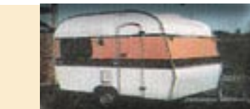
Aracruz - ES

CAMPOS DO JORDÃO (SP-02) – Estrada do Horto Florestal, bairro Rancho Alegre. Instalações-padrão, luz para equipamentos (220v), chuveiros quentes, pavi-