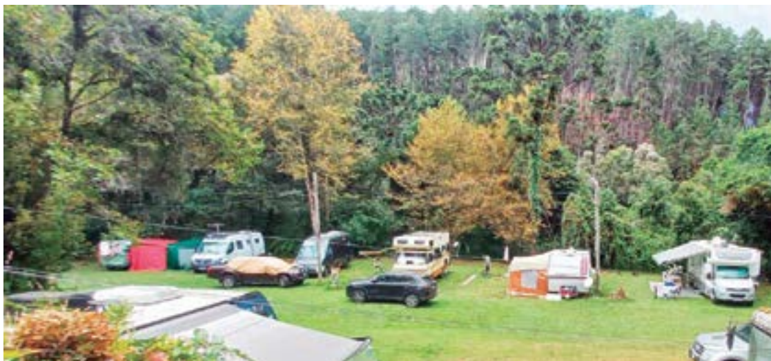
► O Camping de Campos do Jordão tem se preparado para receber os campistas admiradores

vem chegar pela BR-101, até as cercanias do município de Nísia Floresta, entrando no km 119, na Avenida Dr. Severino Lopes da Silva, por detrás do Posto Policial, no sentido da chegada a Natal. Após 2,5 km em pista asfaltada, chega-se ao camping, à direita. Lagoa do Bonfim fica a 25 km antes de Natal, pela BR-101.