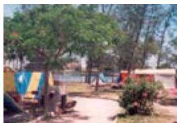
► Camping de Cabo Frio

MURY (RJ-08) – Parque Mury/Debossan. Entrada no km 69 da Estrada Rio-Friburgo, à esquerda da “lombada eletrônica”. Tel.: (22) 2542-2275. Instalações-padrão, luz para equipamentos (220v), chuveiros quentes, quadra de esportes, pavilhão de lazer, sauna, piscinas naturais, ducha de rio e playground. NÃO TEMPORADA: R$ 17,80 mais equipamento de R$ 2,00 até R$ 34,70; TEMPORADA (16/Dez. a 28/Fev.): R$ 22,60 mais equipamento de R$ 3,30 até R$ 41,80.