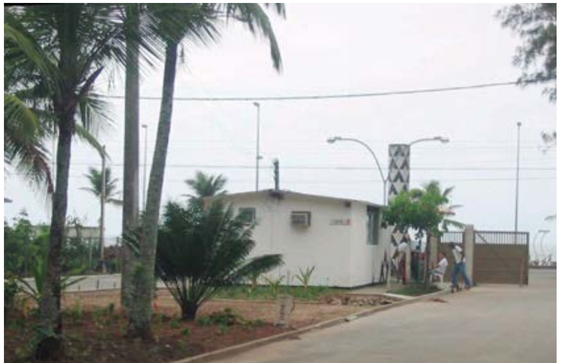
► O Camping do Recreio dos bandeirantes está radiante para receber em massa campistas de todo o país