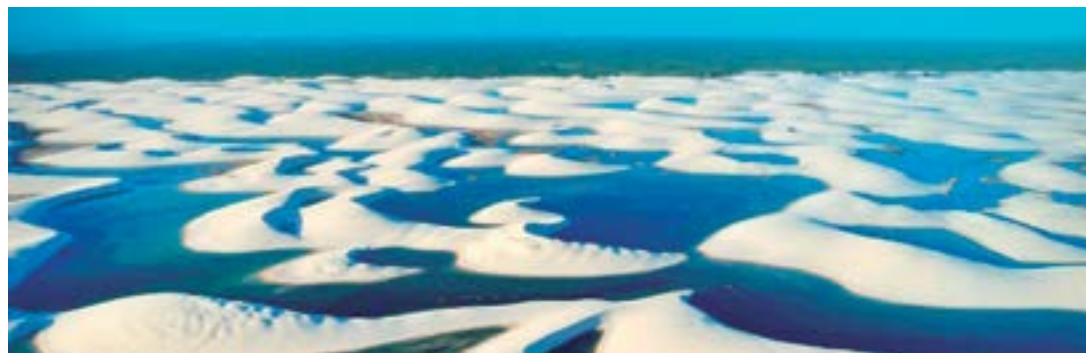
▶ É indescritível a arquitetura na natureza na composição dos Lençóis Maranhenses. É ir lá e ver prá crer!

O Parque Nacional Cavernas do Peruaçu é um complexo subterrâneo, de calcário que abriga sepultamentos pré-históricos e a maior estalactite do mundo. Fica localizado nos Municípios de Januária, São João das Missões e Itacarambí, no norte de Minas Gerais. Faz parte do Circuito Turístico do Velho Chico (Rio São Francisco).