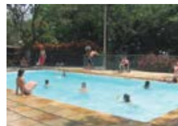
► Camping de Clube dos 500

CLUBE DOS 500 (SP-01) – km 60/SP da Via Dutra, Guaratinguetá (SP). Tel.: (12) 3122-4175. Instalações-padrão, luz para equipamentos (220v), chuveiros quentes, pavilhão de lazer, quadras de esportes, piscinas cloradas e playground. NÃO TEMPORADA: R$ 18,60 mais equipamento de R$ 2,00 até R$ 35,80; TEMPORADA (16/Dez. a 28/Fev.): R$ 19,40 mais equipamento de R$ 3,30 até R$ 37,40.