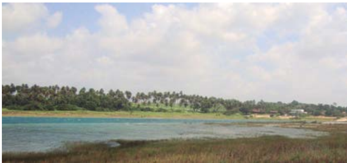
► Acampando na Lagoa do Bonfim, Você pode passear e se divertir no entorno ou simplesmente contemplar