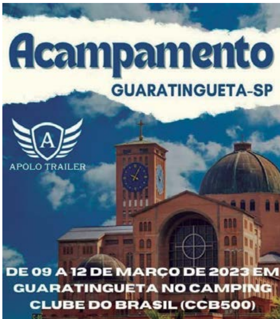
► A Apolo Trailer está convidando clientes e parceiros para seu Evento no SP-01