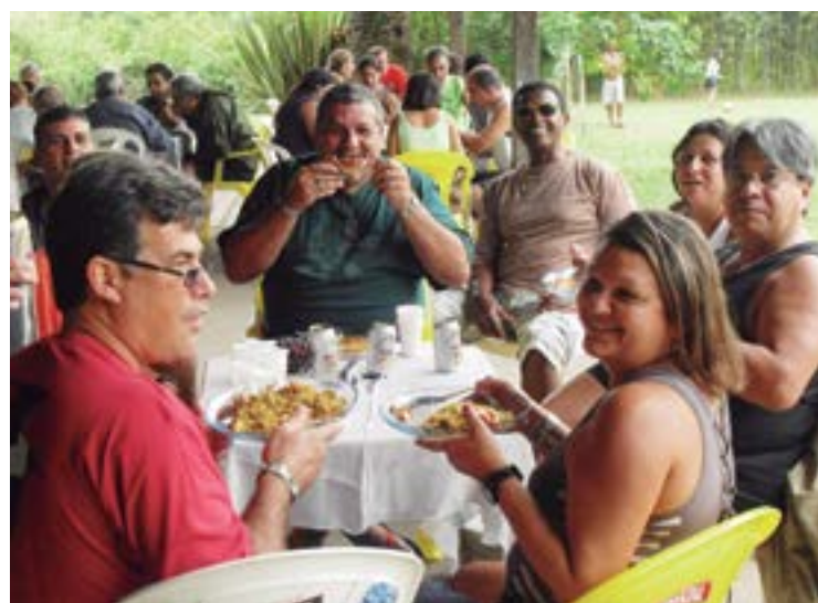
► No segundo feriadão do ano, depois do carnaval, Mury abre o calendário com a tradicional Paella

O Camping de Mury receberá de volta a presença mais intensa dos associados na Paella Dançante, na Festa Julina e no Sambão e Feijoada. O Camping de Bertioga, festeiro por excelência, além dos encontros mensais para brindar aniversariantes, outros eventos estão sendo reprogramados em tor-