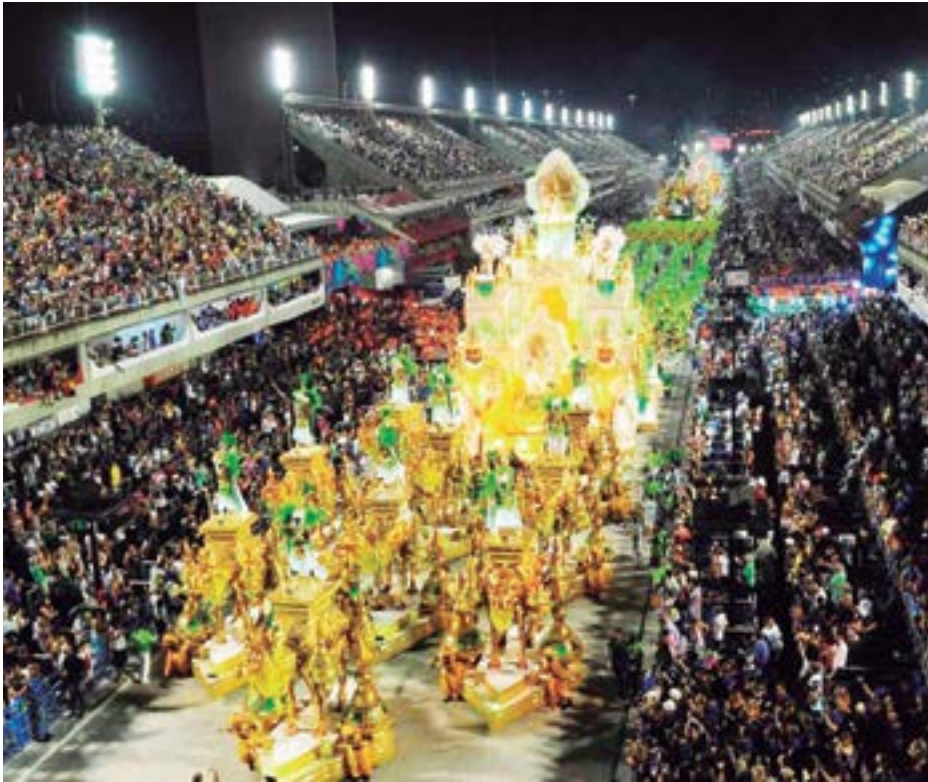
► A contar pela expectativa de retornar aos desfiles, atores e plateia estarão em clima de euforia maior