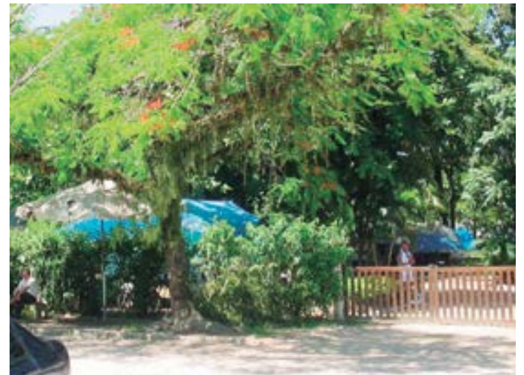
► Com certeza, o Camping de Paraty, defronte à Praia do Pontal continuará presente em todos os eventos

Camping - O RJ-04 está localizado em frente à praia do Pontal, próximo à Santa Casa de Misericórdia. Possui instalações-padrão e tem capacidade para 120 equi-