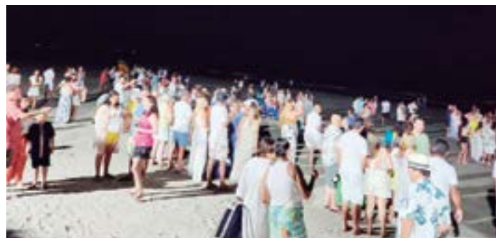
► Em Ubatuba, depois do retorno do brinde na praia, mais animação no pavilhão