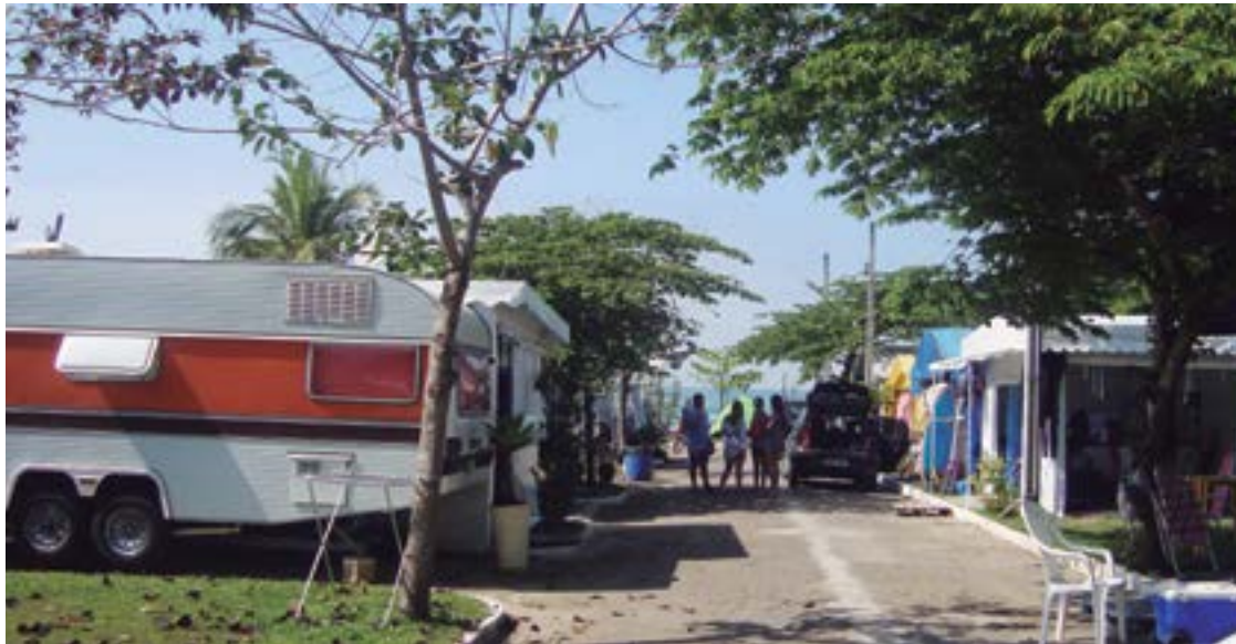
► Posicionamentos e espaços ajustados favorecem até o melhor relacionamento social

Mais recentemente, em 2016, uma nova Resolução Nacional foi editada (nº 01/2016), ratificando aquelas disposições já vigentes, pela necessidade de detalhar ainda mais as normas e condições de permanência desses equipamentos nos campings, priorizando os conceitos de padronização, estética, ocupação ordenada dos espaços, ventilação, manobras, a segurança das pessoas e dos equipamentos e, especialmente, a sua mobilidade imediata, quando e se vier a ser necessária e recomendada. Diz esta Resolução Nacional, em