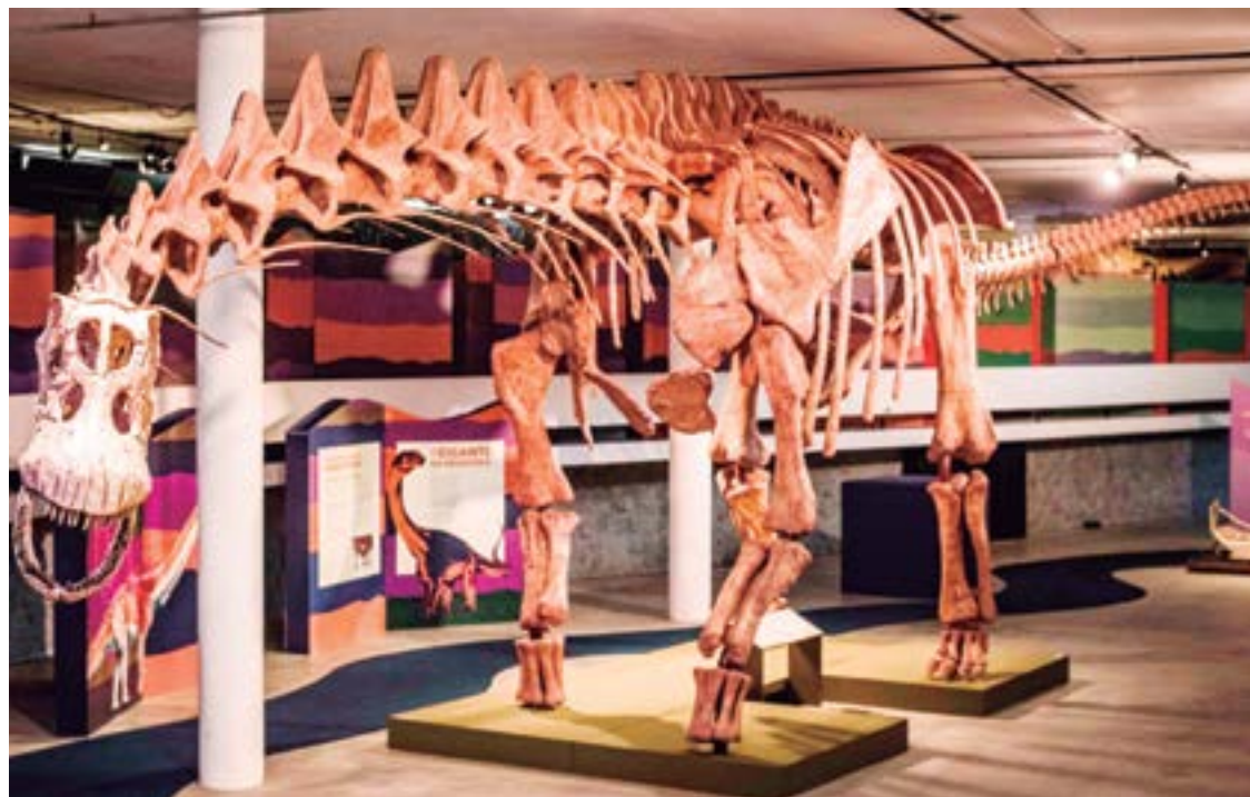
▶ São bem próximas da realidade as réplicas apresentadas em tamanho natural