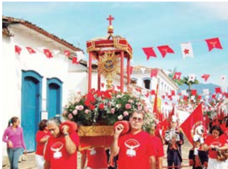
► A Festa do Divino, a mais tradicional, como todos os eventos deste ano, retomam sua vibração presencial

A programação inclui festivais tradicionais já realizados na cidade, que trazem temáticas de cunho cultural e gastronômico, e incorpora novos eventos esportivos, que valorizam a biodiversidade, em locais como praias, trilhas e