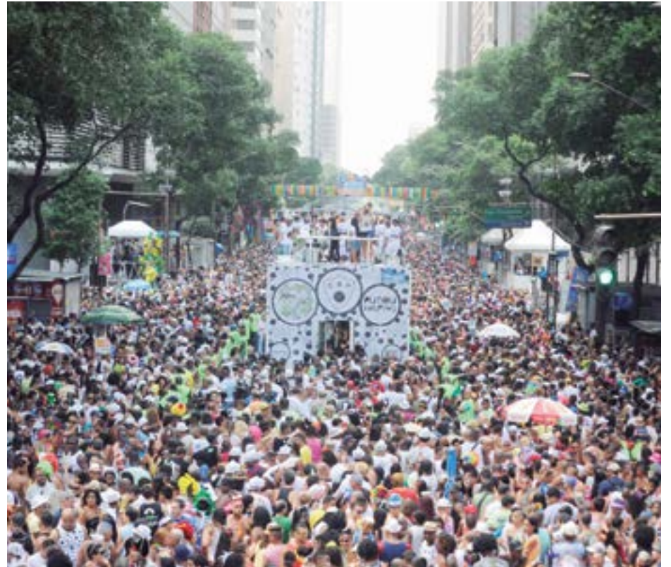
► A partir do dia 20, foliões incansáveis vão desfrutar ao máximo dos blocos de rua