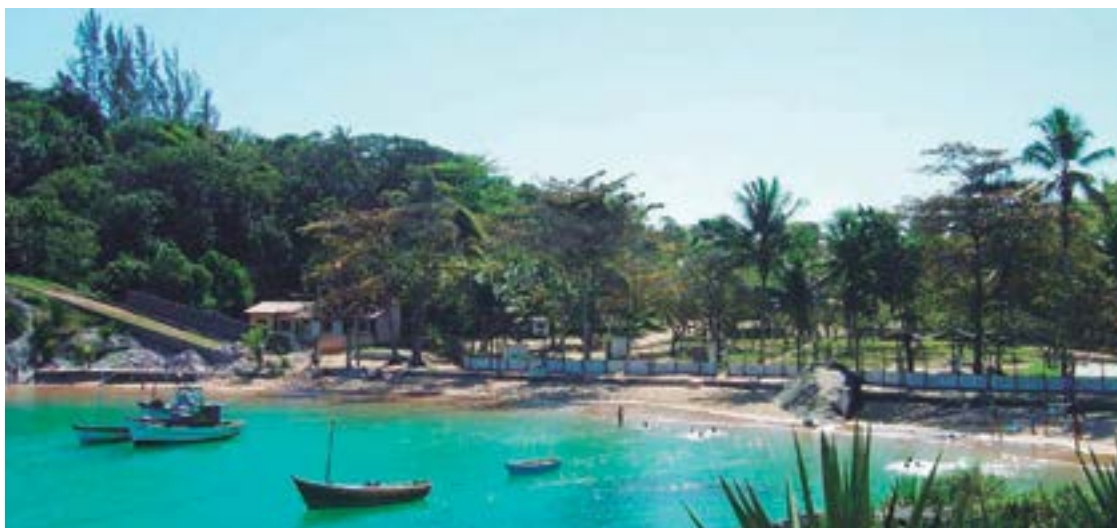
► É difícil falar do Camping de Guarapari sem citar a beleza de sua enseada fronteira