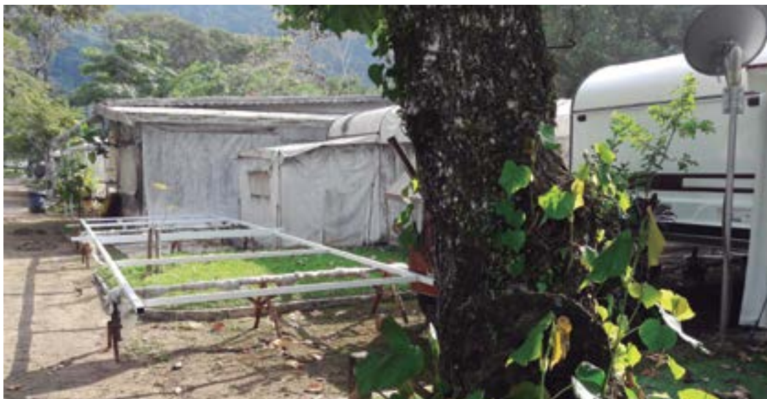
► Projetos de estruturas excedentes e “puxadinhos” sobre módulos vizinhos prejudicam o visual e outros associados

A necessidade de que as coberturas e partes laterais dos avancês (ou barracas) sejam produzidas em materiais plásticos não rígidos, montados sobre perfis metálicos com encaixes simples ou com parafusos do tipo “borboleta”, sem soldas nem rebites, e com a fixação no solo unicamente com estais, tem como sentido principal a segurança e a rapidez em eventuais deslocamentos do equipamento, além, é claro, de garantir conceitos de padronização