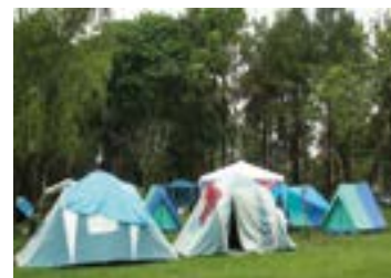
► Camping de Clube dos 500

CLUBE DOS 500 (SP-01) – km 60/SP da Via Dutra, Guaratinguetá (SP). Tel.: (12) 3122-4175. Instalações-padrão, luz para equipamentos (220v), chuveiros quentes, pavilhão de lazer, quadras de esportes, piscinas cloradas e play-ground. NÃO TEMPORADA: R$ 18,60 mais equipamento de R$ 2,00 até R$ 35,80; TEMPORADA (16/Dez. a 28/Fev.): R$ 19,40 mais equipamento de R$ 3,30 até R$ 37,40.