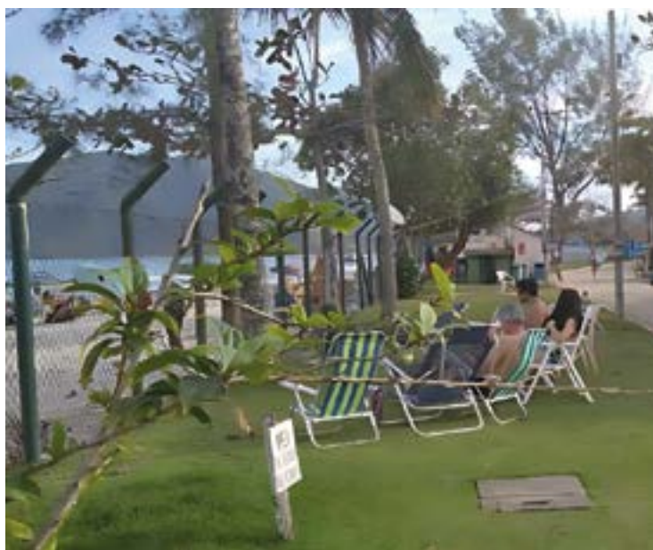
► Em Ubatuba, Você pode somente descansar ou se divertir na cidade

Atrativos – A praia do Farol fica em frente ao camping, possui falésias multicoloridas que formam uma parede entre a vegetação e a areia dourada. Já a praia do Novo Prado tem uma larga faixa de areia plana e é a preferida dos turistas pelo fácil acesso. Ainda na região encontram-se Parques Nacionais como a APA Ponta das Baleias Abrolhos, que recebe a visita anual das baleias Jubarte. Para quem procura um perfil mais cultural, o visitante não pode deixar de conhecer lugares como a Matriz de Nossa Senhora da Purificação, o prédio da antiga Cadeia Pública, o prédio da Pousada Colonial e a