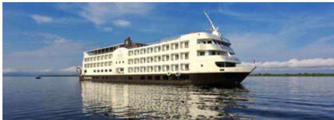
► A bordo do Iberostar, pela Amazônia, Você se insere em trilhas, focagem de animais, passeios em lanchas, pescarias programadas e muito mais

Reafirmando o conceito de melhor conhecer para defender e preservar, é sempre válida a sugestão de programar em suas próximas viagens de lazer um cruzeiro pela Amazônia a bordo do navio Iberostar Grand Amazon, em cabines exclusivas com varandas, alimentação "all inclusive", piscinas, sala fitness, o Restaurante Kuarup com gastronomia típica ou convencional, em três noites pelo Rio Solimões, ou em quatro pelo Rio Negro, sempre com variadíssimos programas pelo percurso. Consulte a CCTUR!