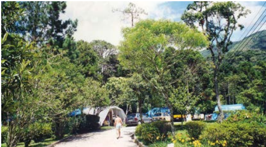
► Além das variedades do entorno na gastronomia, lazer e compras, o camping é uma atração à parte

Em Mury, é rica a presença de vegetação, nascentes de águas cristalinas, bem como belos pinheiros e outras espécies características da região, inclusive a famosa Araucária, do Paraná, em extinção. Importante referência é o Circuito Sabor Mury, composto de rica e variada gastronomia, os seus restaurantes típicos, oferecendo diversos pratos regionais e internacionais, além de deliciosos queijos, biscoitos amanteigados e doces caseiros. Os visitantes dispõem de inúmeras lojas de artesa-