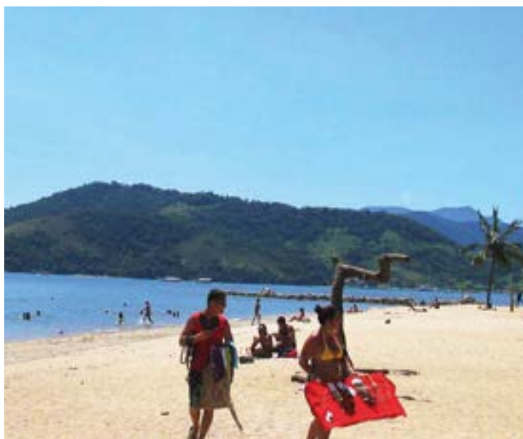
► Defronte à praia do Pontal, o Camping de Paraty também oferece descanso e folia

Casa Colonial do Beco das Garrafas, além de belas construções do século XIX que fazem parte do turismo histórico e arquitetônico.