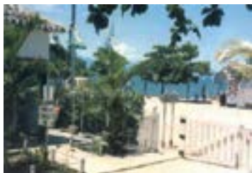
► Camping de Paraty

MURY (RJ-08) – Parque Mury/Debossan. Entrada no km 69 da Estrada Rio-Friburgo, à esquerda da “lombada eletrônica”. Tel.: (22) 2542-2275. Instalações-padrão, luz para equipamentos (220v), chuveiros quentes, quadra de esportes, pavilhão de lazer, sauna, piscinas naturais, ducha de rio e play-ground. NÃO TEMPORADA: R$ 17,80 mais equipamento de R$ 2,00 até R$ 34,70; TEMPORADA (16/Dez. a 28/Fev.): R$ 22,60 mais equipamento de R$ 3,30 até R$ 41,80.