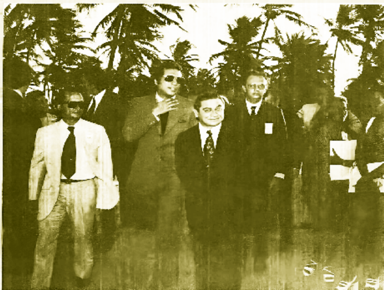
O Presidente do CCB recebe em sua casa, em Aracaju, o Governador de Sergipe e os Presidentes da Embatur e da Embratur