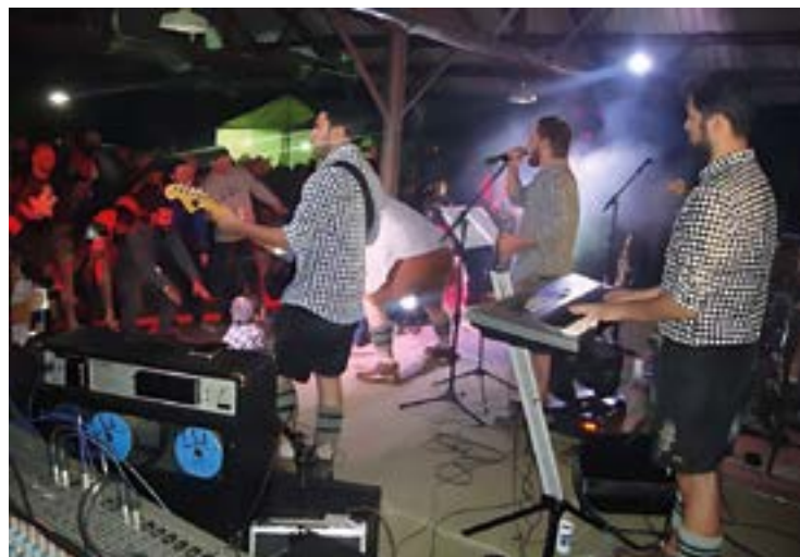
► A Banda Tureck está confirmada na Noite de Queijos e Vinhos no dia 10 de junho, "feriadão" de Corpus Christi

Confirmada a Noite de Queijos e Vinhos na Serrinha em 10 de junho