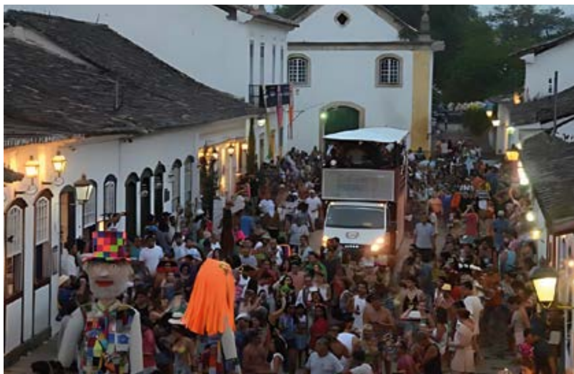
► Os blocos tradicionais atraem os foliões pelas ruas do centro histórico

A Banda Santa Cecília e o Bloco da Lama estão entre os destaques do calendário, que conta ainda com a presença de agremiações menores, como Os Caras de Pau, o Nega Maluca e o Bloco das Piranhas. Seus integrantes vestem fantasias e acompanham as atrações que se