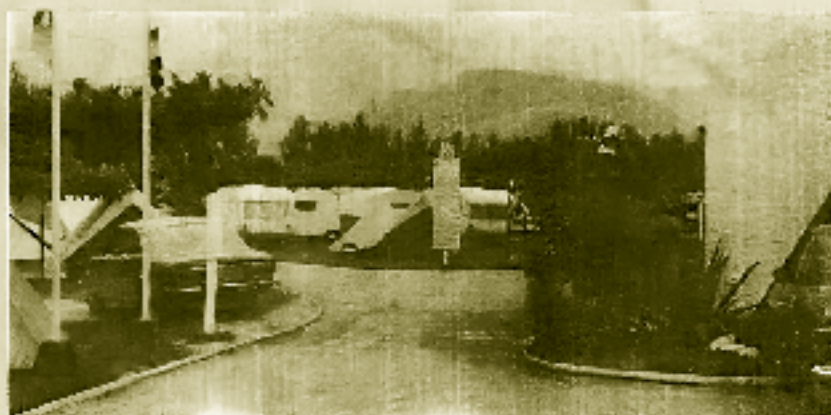
Barra da Tijuca