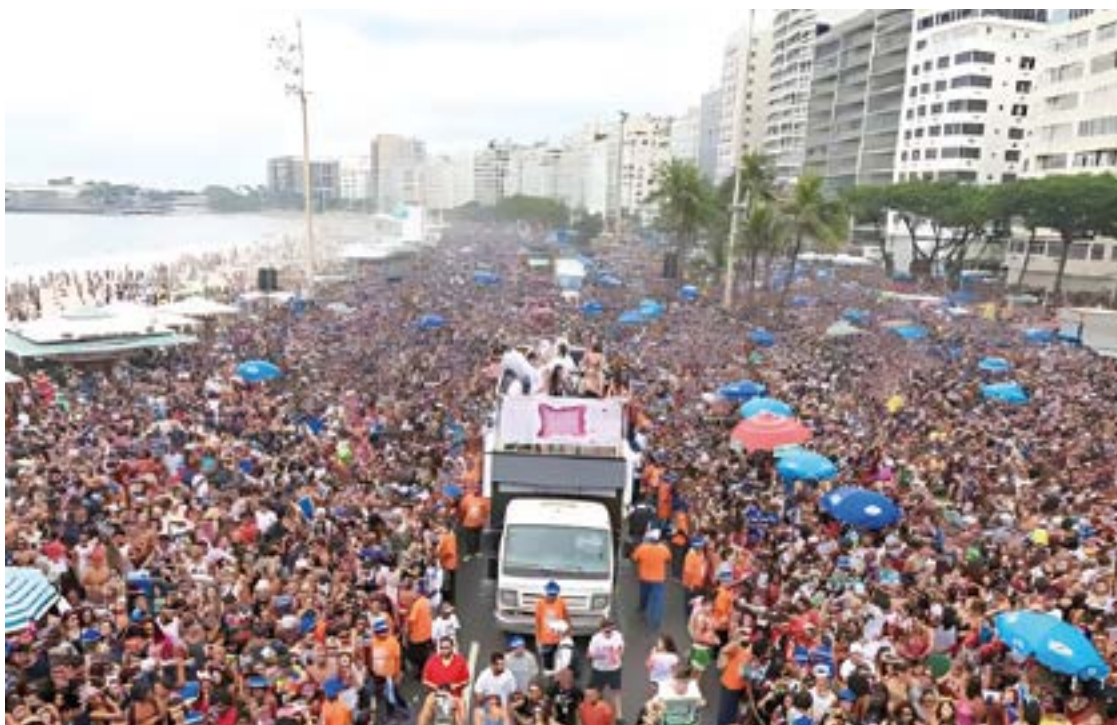
► Os desfiles se concentram na passarela montada na Praia do Forte

A Folia dos blocos começa no dia 11, com o bloco “Encosta que ele cresce”, das 19h às 23h59min, fazendo o “concentra, mas não sai” na Rua Major Belegard, 171. O tradicional “Que merda é essa” sai no sábado (18), das 19h às 23h59min, com a concentração na Major Belegard, e o desfile cobrindo a Av. Assunção, com dispersão na Rua 13 de Novembro. Já o “Bloco das Damas”, que tem expectativa de