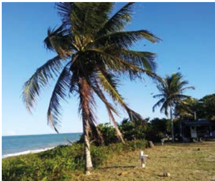
► Há quem prefira curtir o Carnaval de Prado, mas a maioria prefere a Praia do Farol