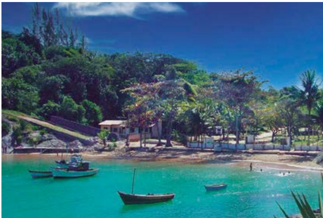
► Defronte à tranquila Enseada de Setiba, o camping agrada especialmente às crianças

Marco da fundação de Guarapari, essa igreja foi erguida no alto de uma colina, no século XVI, pelo padre José de Anchieta. Suas paredes externas tiveram conchas como revestimento, fato que deu origem ao apelido “Igreja das Conchas”. Anexo à construção, atualmente, há também a Paróquia de Nossa Se-