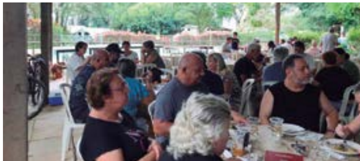
► Outro momento de integração em torno de uma feijoada ao lado das piscinas