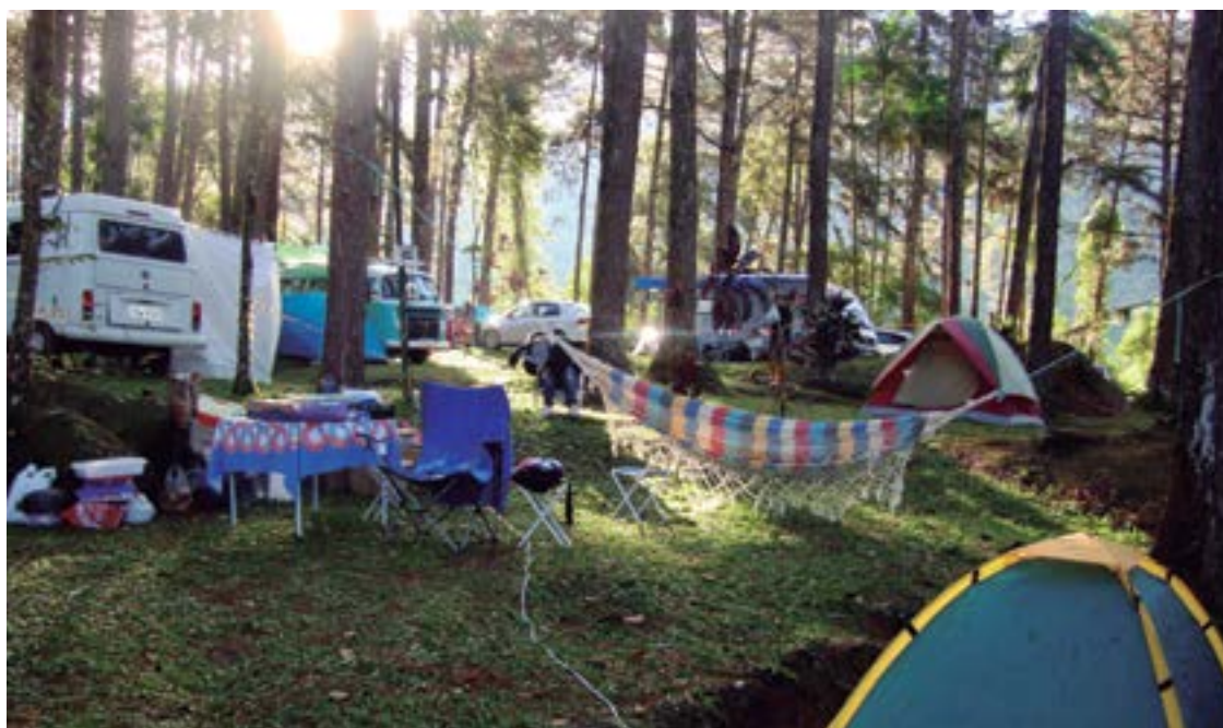
► A área de acampamento, em meio à simplicidade e a paz da natureza