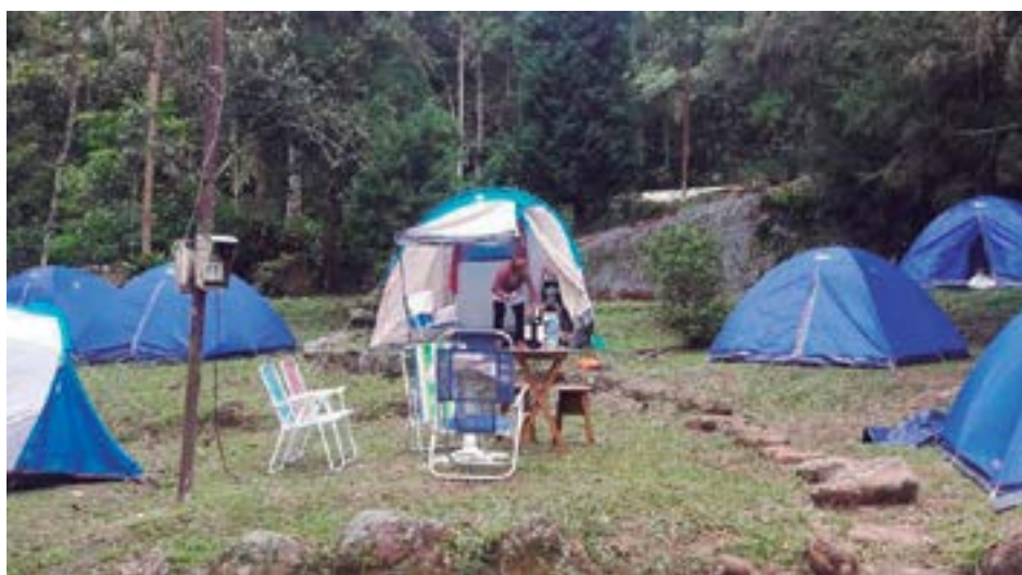
► Natureza, gastronomia e lazer no entorno do Camping de Mury