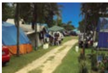
► Camping de Bertioga

BERTIOGA (SP-05) – Av. Anchieta, 10.500 – Jardim Rafael. Tel.: (13) 3311-9329. Luz para equipamentos, chuveiros quentes, pavilhão de eventos, praia fronteiria. NÃO TEMPORADA: R$ 18,60 mais equipamento de R$ 2,00 até