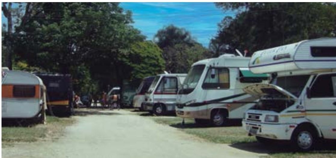
► Programas ecológicos e religiosos são opções quando se acampa no Clube dos 500

Atrativos - A cidade de Guaratinguetá, cercada pelas serras da Mantiqueira e Quebra-Cangalha, destaca-se pelo turismo ecológico. Para quem gosta de caminhar são indicadas as trilhas das Pedrinhas, propícias a escalada e ao rapel; a do Pirizal, onde os campistas enfrentam cerca de três horas de caminhada; e a dos Pilões, que foi utilizada no ciclo do ouro, com um percurso de aproximadamente cinco horas. Guaratinguetá também é bastante conhecida pelo lado religioso, já que é o local de nascimento de Frei Antônio de Sant'Ana Galvão, o primeiro santo do Brasil. Por isso, alguns dos lugares mais visitados no município são a Casa e o Museu de Frei Galvão, onde é possível encontrar um pouco da arte sacra, artesanato regional, documentos e objetos históricos e exposições. Em Aparecida, nas proximidades, o destaque fica por conta da Basílica que recebe milhares de fiéis todos os meses.