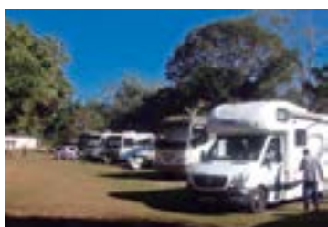
► Camping de Caldas Novas

CALDAS NOVAS (GO-02) – Rodovia Caldas/Ipameri (Aeroporto), a 4 km do centro da cidade. Instalações – padrão, luz para equipamentos (220v), chuveiros quentes, quadra de esportes, sauna, piscinas quentes p/adultos e crianças, piscina cloradas de água fria p/adultos. NÃO TEMPORADA: R$ 19,60 mais equipamento de R$ 2,00 até R$ 29,40; TEMPORADA (16/Dez. a 28/Fev.): R$ 29,00 mais equipamento de R$ 3,30 até R$ 43,60.