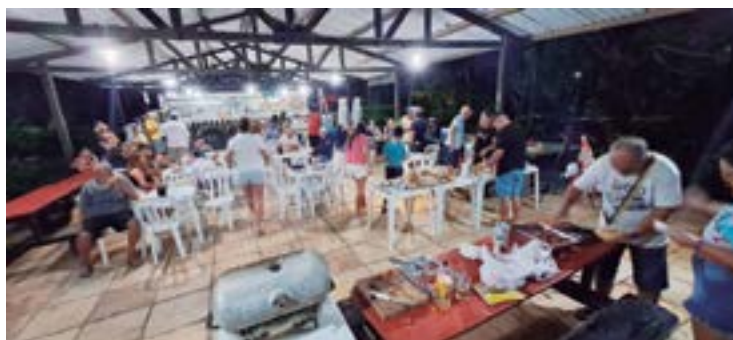
► Os visitantes no primeiro momento de confraternização