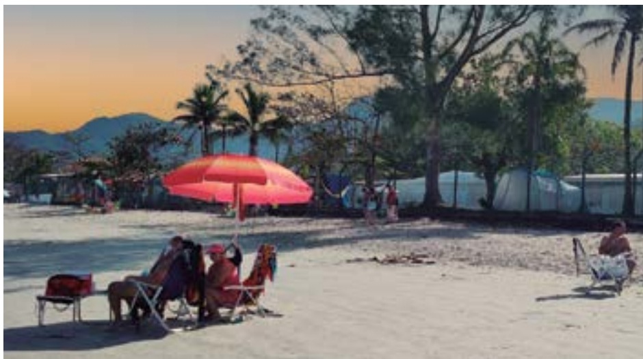
► O Camping de Ubatuba oferece praia, fronteira e vários programas de lazer ao redor