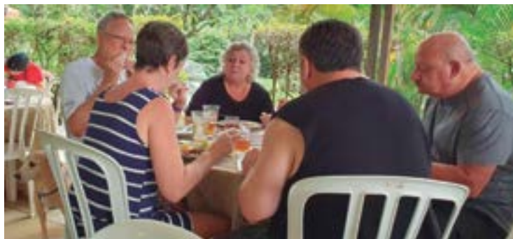
► Rever amigos e programar viagens, uma troca sempre saudável

Foram mais de cinquenta equipamentos, entre trailers, motor-homes e barracas, presentes no Encontro dos Amigos da Apolo Trailers, no Camping do Clube dos 500, entre 9 e 12 de março passado.