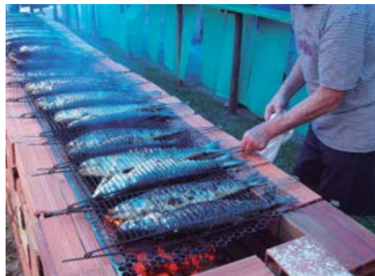
► Vem aí, em 22 de julho, a Festa da Tainha em Ubatuba

História e Religiosidade em Paraty (Página 9)