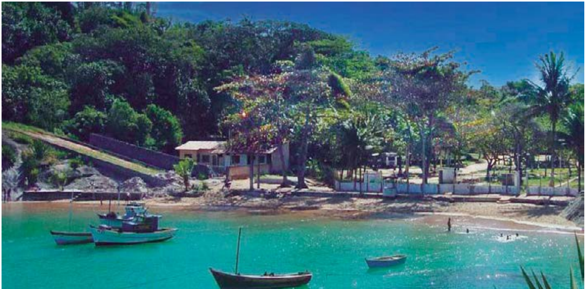
► O Camping de Guarapari, defronte à Enseada de Setiba, é base para passeios interessantes na cidade (Página 7)