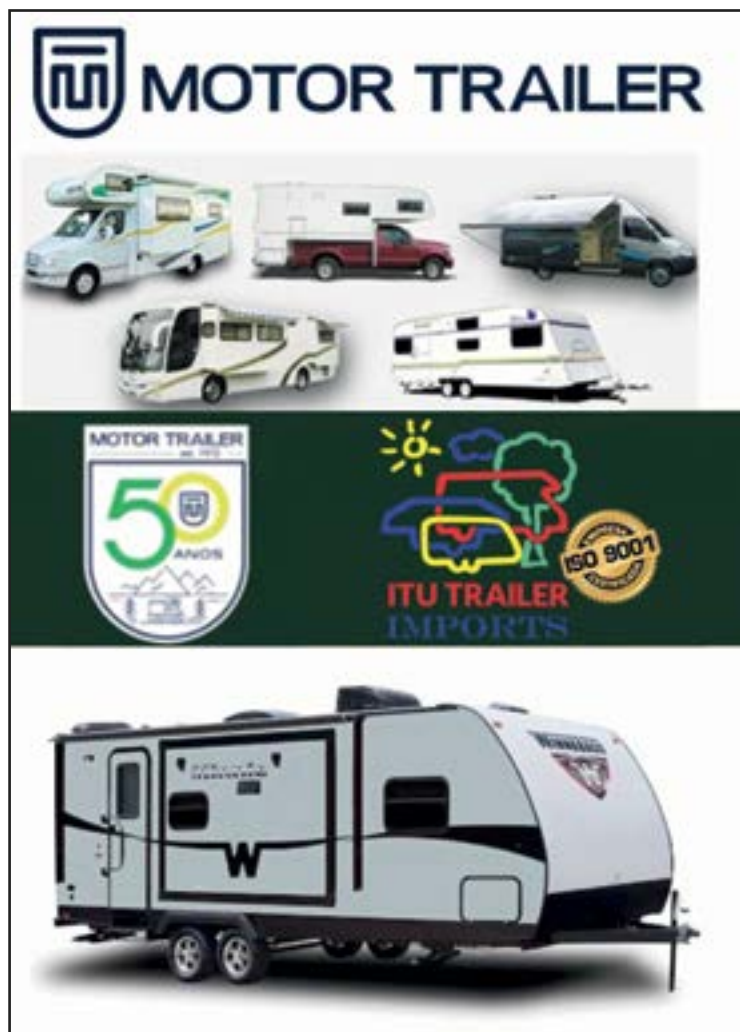
► A integração com o campismo é parte da missão do Grupo

Veja os artigos de camping e adquira o seu produto