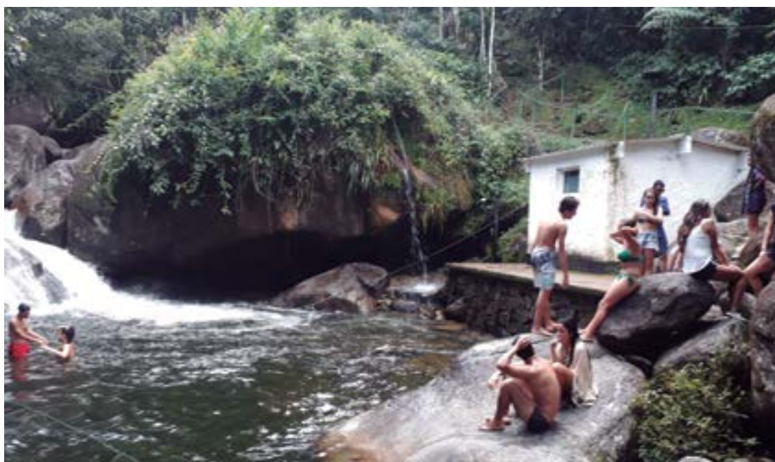
► O módulo da sauna, junto ao Poço de Cima, reformado para receber os campistas