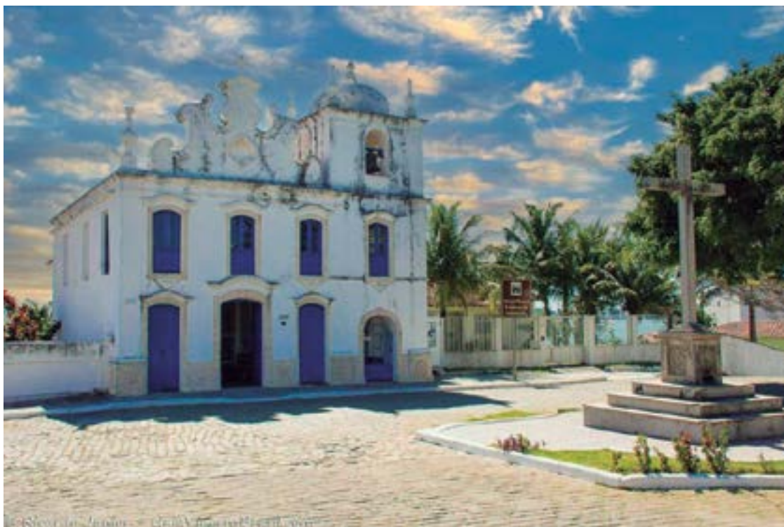
► Monumento histórico do Século XVI, a Igreja da Conceição é um passeio fascinante

nhora da Conceição, que apresenta um relevante acervo sacro, com peças do século XVIII. Ela fica aberta para visitação nos horários das missas.